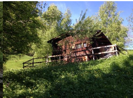
Apéro auf Maiensäss «Schärtegg»