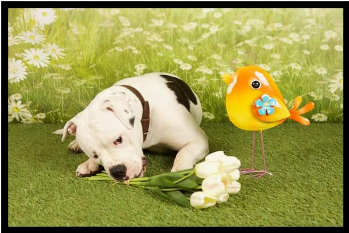
Oudsbergen Dogs' Yuma