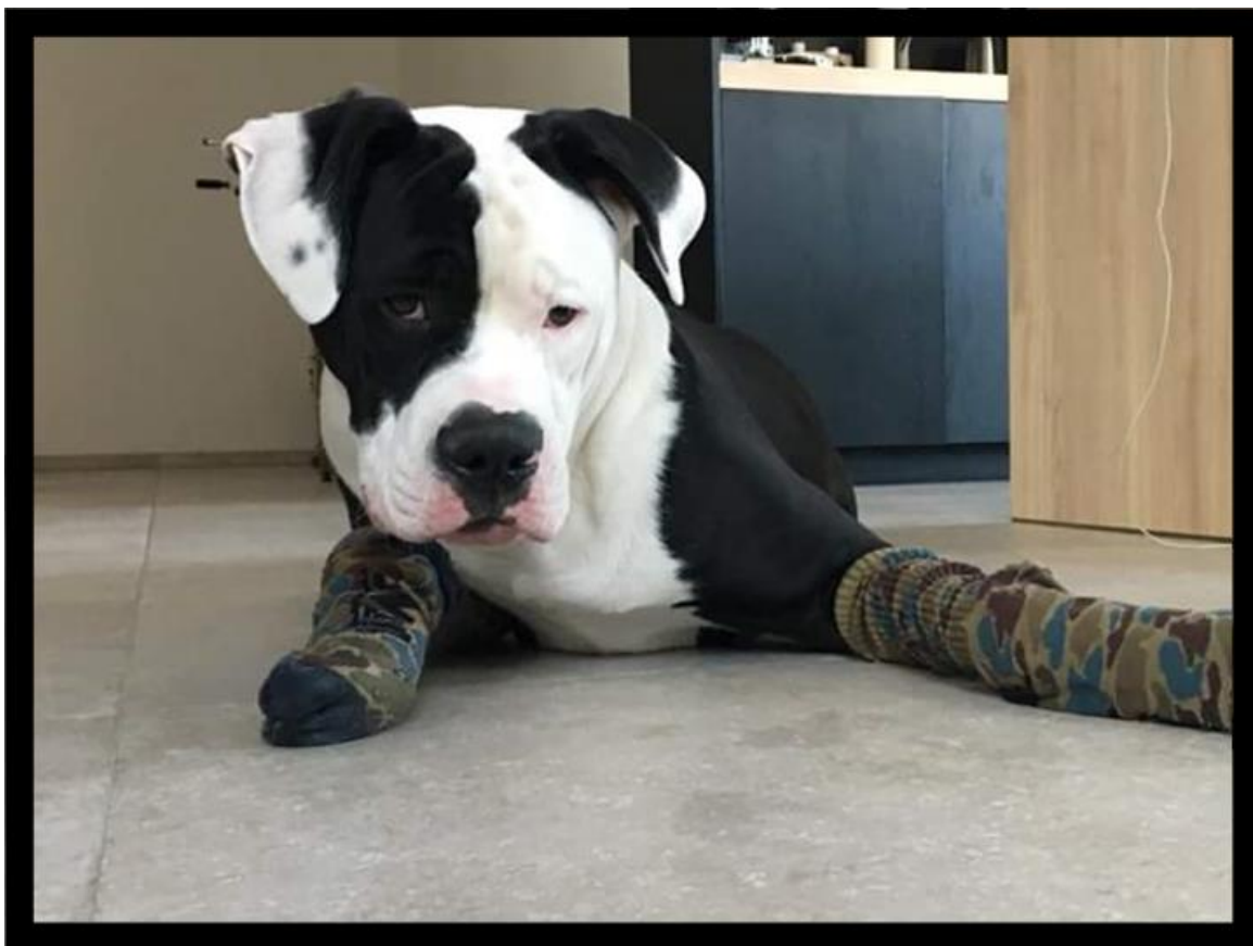
Oudsbergen Dogs' Xibor