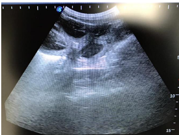
Echo (dag 28) meervoudige zwangerschap bevestigd

Heeft u een goed gevoel bij ons en onze werkwijze en overweegt u, nadat u goed nagedacht heeft, om een pup bij ons te kopen dan kan u geheel vrijblijvend op onze wachtlijst geplaatst worden. Wij houden u dan op de hoogte van de gebeurtenissen. Zo zullen wij u laten weten wanneer onze teef pups verwacht, wanneer de pups geboren zijn etc.