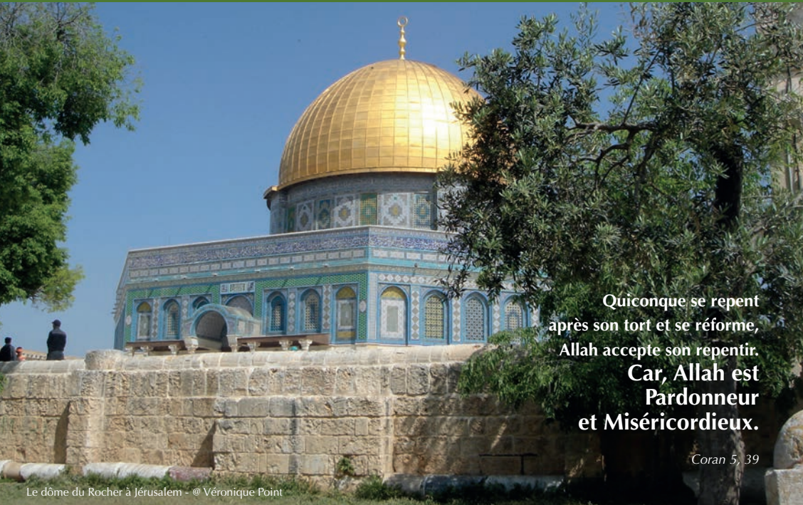
Le dôme du Rocher à Jérusalem

Quiconque se repent après son tort et se réforme, Allah accepte son repentir. Car, Allah est Pardonneur et Miséricordieux.