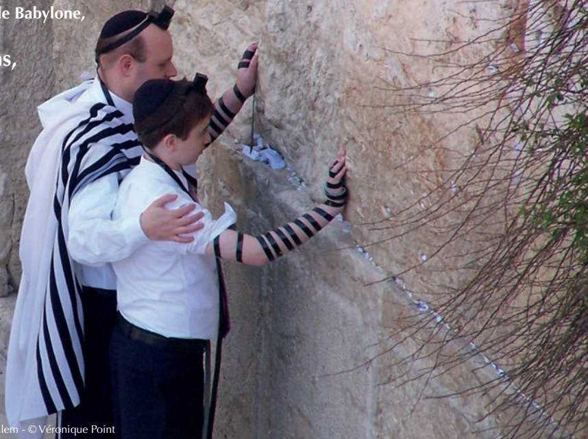
Au Mur des Lamentations, Jérusalem