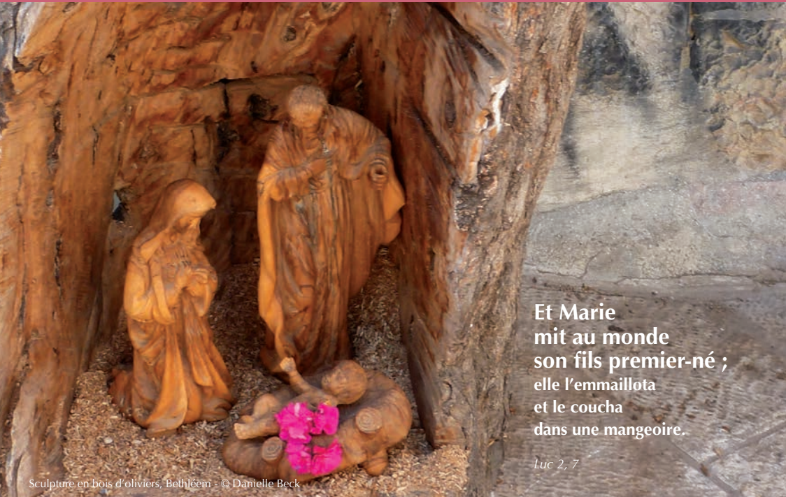
Sculpture en bois d'oliviers, Bethléem

Et Marie mit au monde son fils premier-né ; elle l'emballota et le coucha dans une mangeoire.