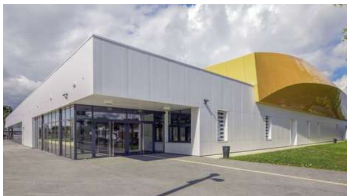
Salle omnisports Bellegrave, avenue du Colonel Robert Jacqui, 33600 PESSAC