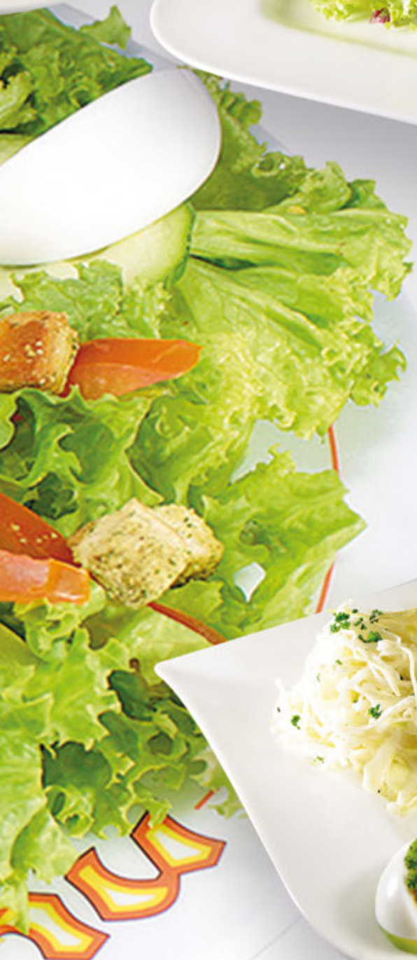
328 Römer Salat 15,10 € Zwei mit Tomate-Mozzarella gefüllte Knusperschnitzel (ohne Fett gebraten), gemischte Blattsalate, Möhren- und Weißkrautsalat, Tomaten und Ei, dazu eine Portion Flûte, Dressing nach Wahl. 1.