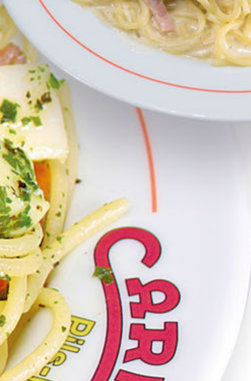
403 Erfrischung Grande 15,10 € 350 g. Spaghetti, Kräuterpesto, 160 g. Mozzarella und Tomatenstreifen. 1. 9.