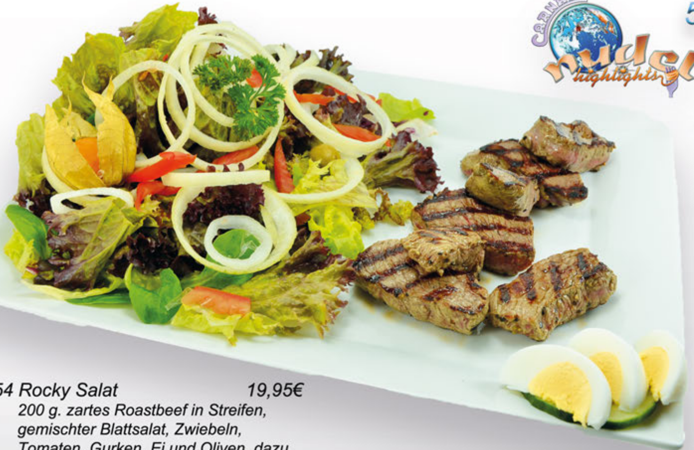
454 Rocky Salat 19,95€ 200 g. zartes Roastbeef in Streifen, gemischer Blattsalat, Zwiebeln, Tomaten, Gurken, Ei und Oliven, dazu eine Portion Flûte, Dressing nach Wahl. 1.