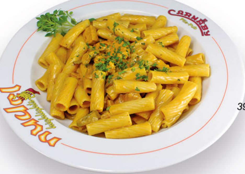
396 Rigatoni Doris 14,50 € 350 g. Rigatoni und 400 g. Putenbrust- Geschnetzeltes in Champignon- Curry-Sahnesauce. 1. 8. 9. 11.