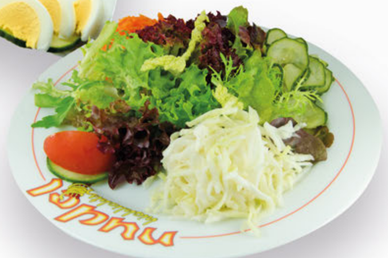
319 Carnaby Salat 7,20 € Gemischte Blatt- und Rohkostsalate, Dressing nach Wahl.