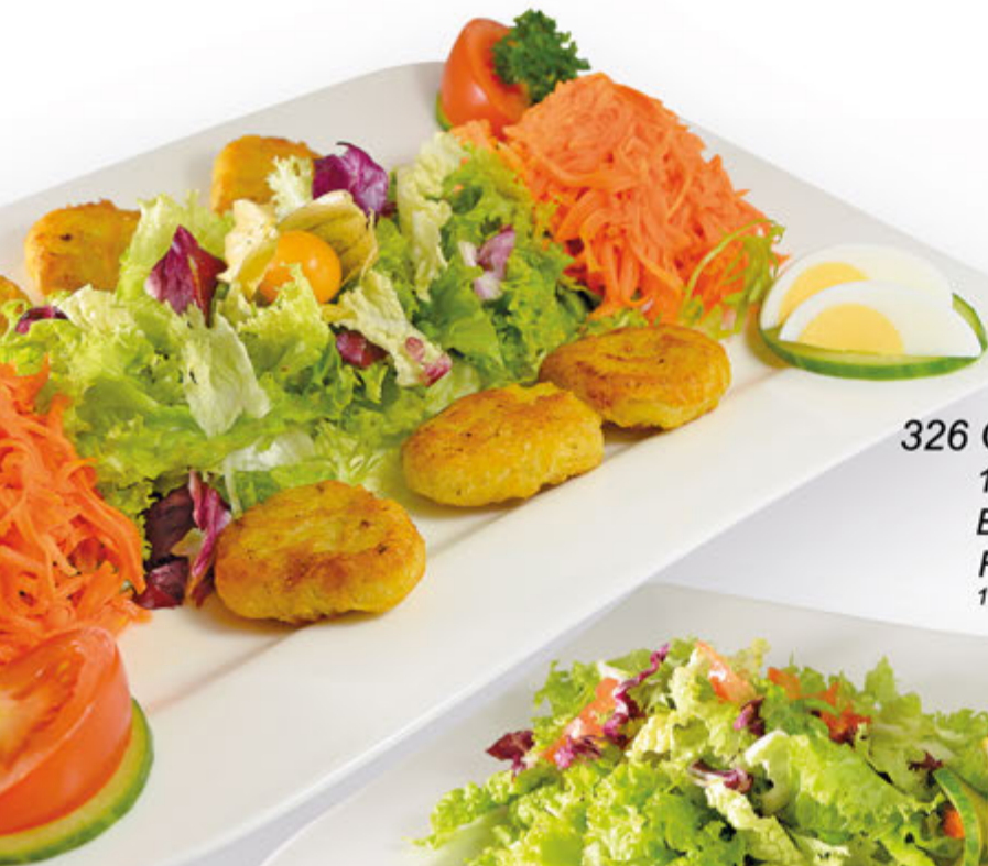
326 Olympia Silber 10,70 € 150 g. Gemüseschnitzel und gemischte Blattsalate, dazu eine Portion Flûte, Dressing nach Wahl. 1.