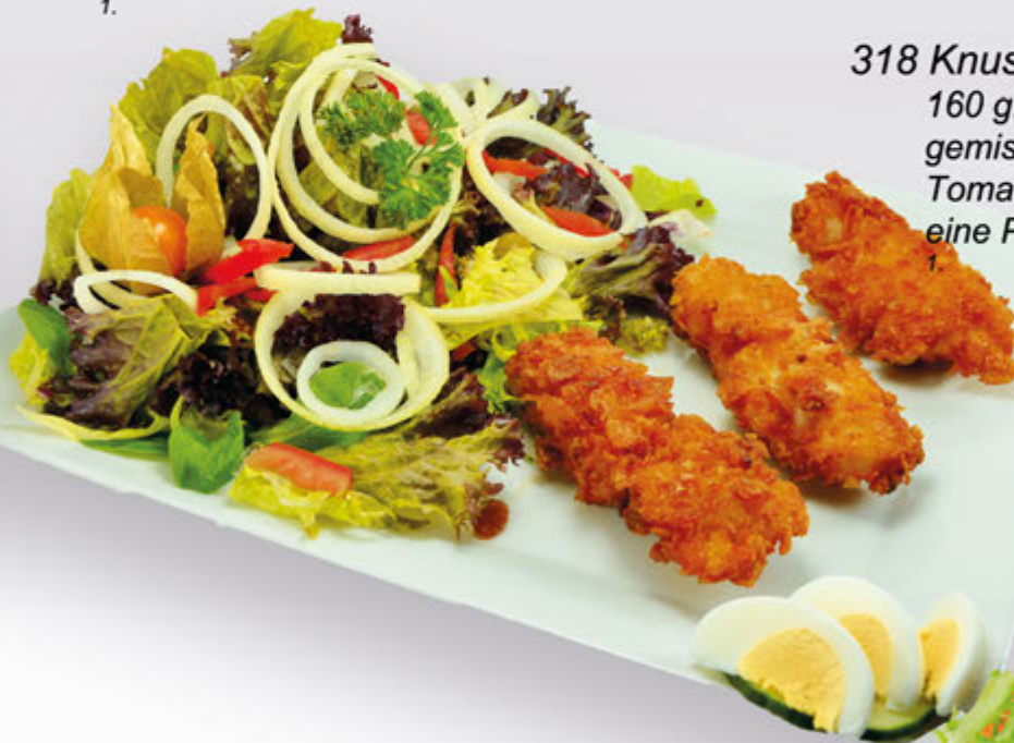
318 Knusper Salat 14,20 € 160 g. Hähnchenstreifen im Knuspermantel, gemischer Blattsalat, Zwiebeln, Tomaten, Gurken, Ei und Oliven, dazu eine Portion Flûte, Dressing nach Wahl.