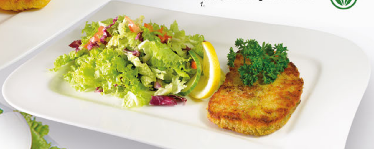
327 Römer Salat Mini 11,20 € mit einem gefüllten Knusperschnitzel, dazu eine Portion Flûte, Dressing nach Wahl. 1.