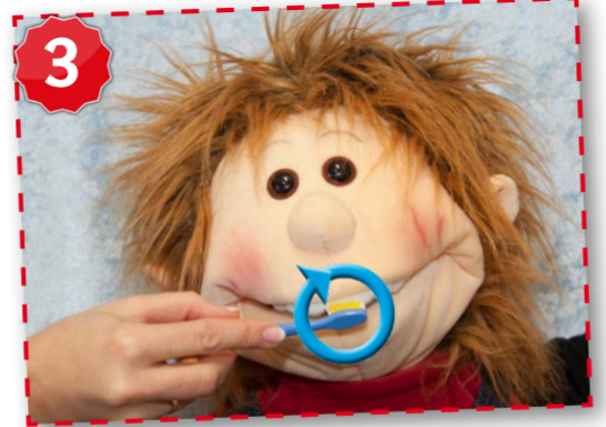
Zähne aufeinander stellen.

K AUFLÄCHEN mit kurzen hin-und-her -Bewegungen bürsten. Oben beginnend von hinten nach vorne und zurück, danach dasselbe unten.