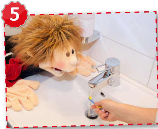
Schaum ausspucken, die Zahnbürste abspülen und ausklopfen.

I NNENFLÄCHEN mit heraus- fe genden Bewegungen zuerst oben und schließlich unten reinigen.