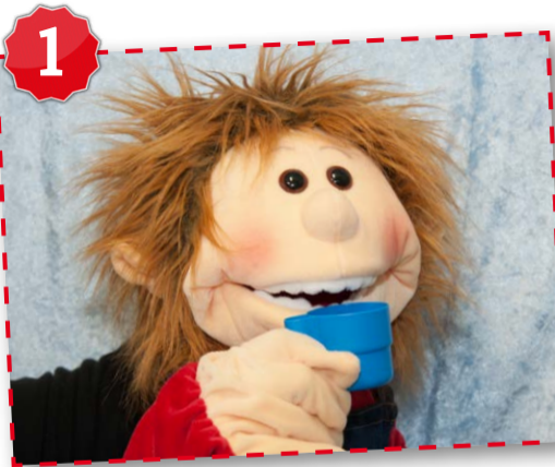
Mund gründlich ausspülen und Zahnbürste anfeuchten.