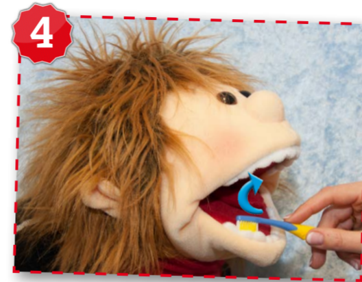
Mund wieder weit öffnen.

A USSENFLÄCHEN mit kleinen Kreis bewegungen von hinten nach vorne und wieder nach hinten putzen.