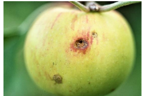
mit Wicklerlarve befallener Apfel

Mit Obstmadenfallen (Pheromonfallen) wird der Flughöhepunkt des Schädlings ermittelt. Die Fallen dienen nur der Kontrolle, eine wirkungsvolle Bekämpfung ist hiermit nicht möglich.