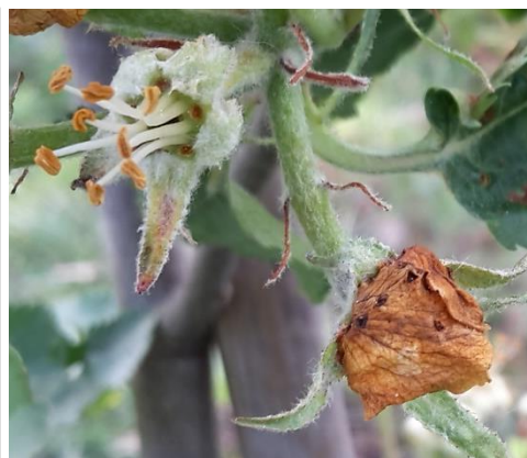
Apfelblütenstecher, rechts befallene Knospe

Die Weibchen des Apfelblütenstechers ( Anthonomus pomorum ) legen ihre Eier in die geschlossene Blütenknospe, die sich in der Folge nicht öffnet. Die braunen Blütenblätter bleiben lange am Fruchtknoten, in dem sich die Larve weiterentwickelt und verpuppt. Starker Befall kann durch Abklopfen der Käfer ab März (Rüsselkäfer mit v-förmiger Flügelzeichnung) und rechtzeitiges Abpflücken der befallenen Blüten reduziert werden, meist sind aber Blüte und Fruchtknoten sowieso reichlich.