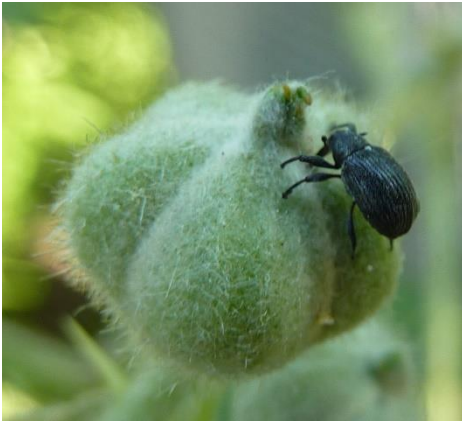
Blütenstecher auf Knospe