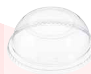
Tapa domo con orificio ancho