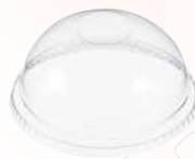
Tapa domo sin orificio