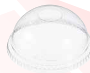
Tapa domo con orificio