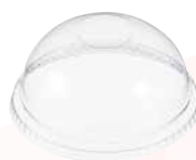
Tapa domo sin orificio