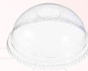
Tapa domo con orificio