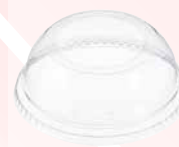
Tapa domo con orificio ancho

1 tamaño de tapa le queda a 2 diferentes tamaños de vasos