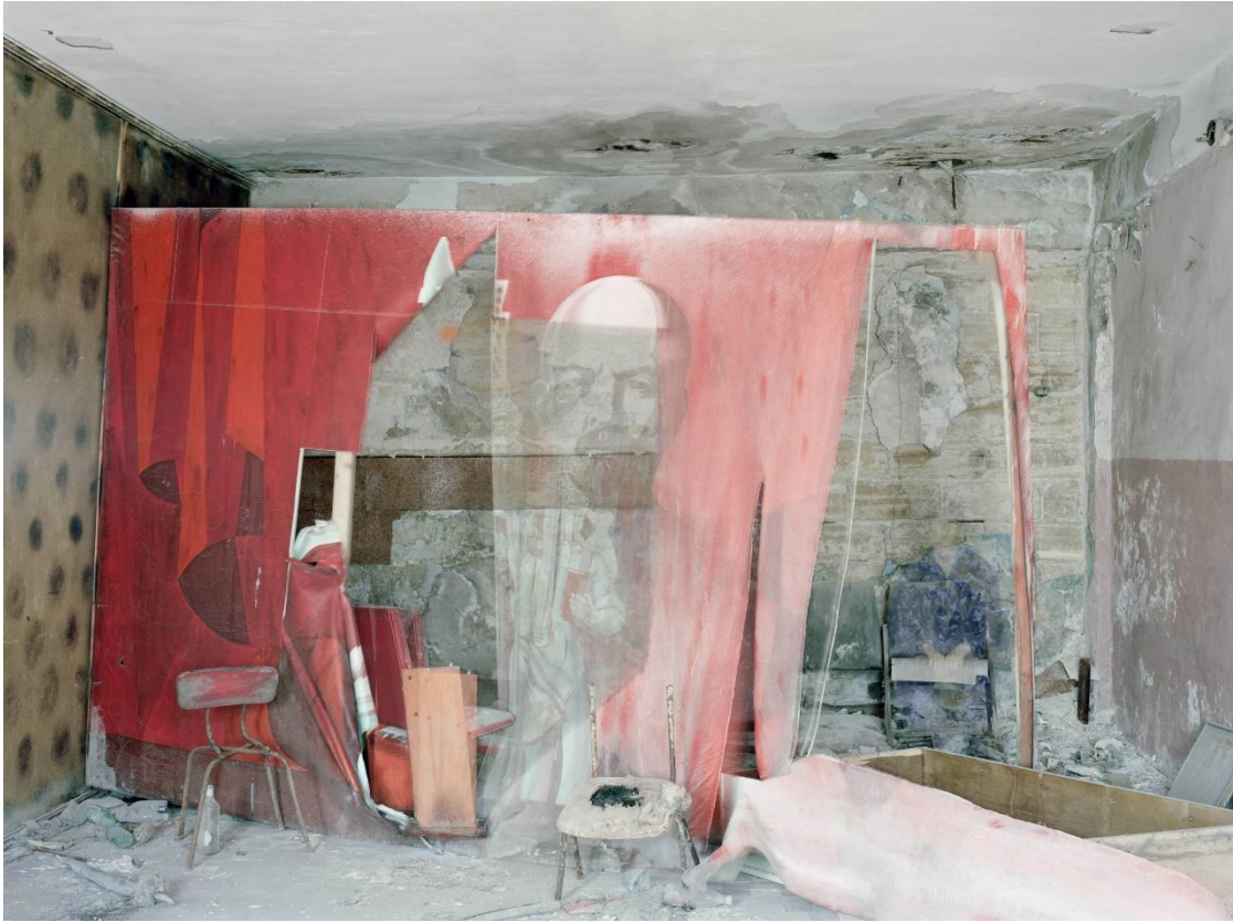
Good Bye Lenin, 2012