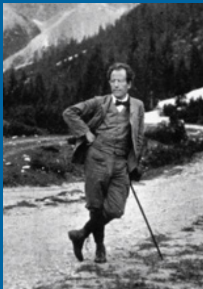
Gustav Mahler beim Wandern im Fischleintal, 1909 / Gustav Mahler durante un'escursione in Val Fiscalina, 1909