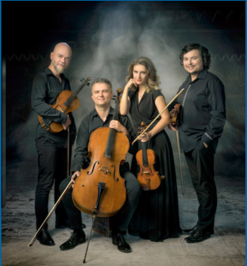
Arcadia Quartet & friends