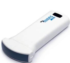
myMIDES Convexsonde C3cs