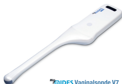
myMIDES Vaginalsonde V7