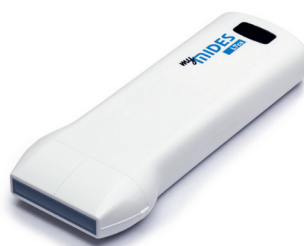
myMIDES Linearsonde L7cs