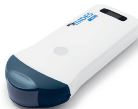
myMIDES Convexsonde MC3