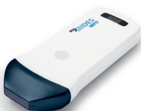
myMIDES Linearsonde L10c