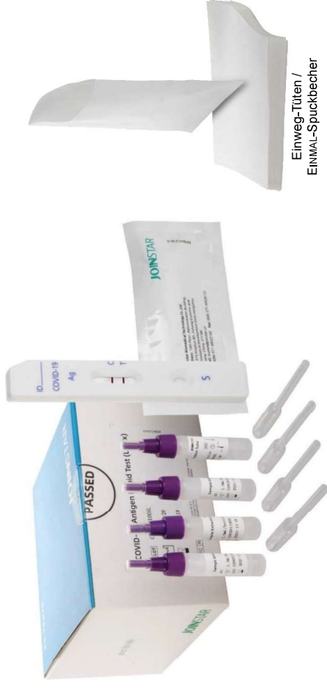
Einweg-Tüten / EINMAL-Spuckbecher