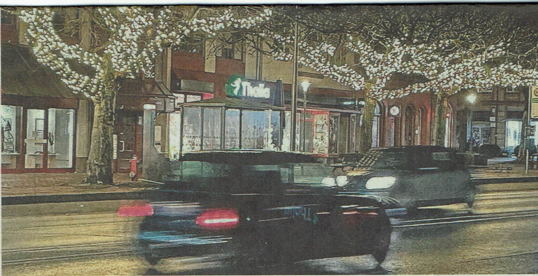
Stimmungsvoll wie auf dem Marktplatz: Seit einigen Wochen sind auch die Platanen auf dem Haarmanplatz mit Lichterketten geschmückt.