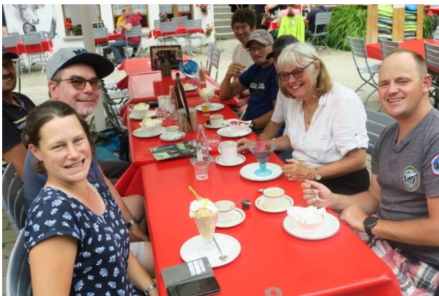
Restaurant Pochtenfall im Suldtal

Zur Erholung war am nächsten Tag ein Ausflug ins Suldtal bei Aeschi angesagt. Dieses Tal mit dem grossen Pochtenfall (81 Meter) ist einzigartig. Wir fanden auf unserer Flusswanderung einen gemütlichen Picknickplatz und brätelten. Danach gab es im Restaurant Pochtenfall verschiedene leckere Coupes. Mit dem Postauto und dem Zug ging es dann wieder zurück nach Brienzwiler. Am Abend besuchten wir das Freilichttheater im Ballenberg und schauten uns das Stück „Wyberhaagge“ mit Beat Schlatter an. Sogar der Schwingerkönig Matthias Glarner trat am Ende des Stückes kurz auf.