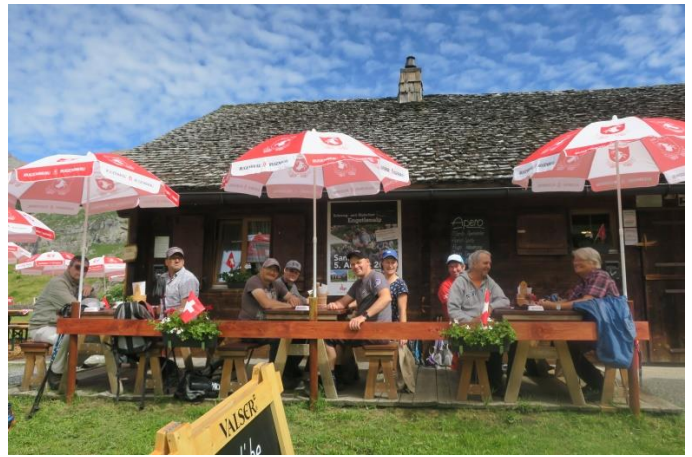
Alphütte Rossboden Engstlenalp

Zur Erholung war am nächsten Tag ein Ausflug ins Suldtal bei Aeschi angesagt. Dieses Tal mit dem grossen Pochtenfall (81 Meter) ist einzigartig. Wir fanden auf unserer Flusswanderung einen gemütlichen Picknickplatz und brätelten. Danach gab es im Restaurant Pochtenfall verschiedene leckere Coupes. Mit dem Postauto und dem Zug ging es dann wieder zurück nach Brienzwiler. Am Abend besuchten wir das Freilichttheater im Ballenberg und schauten uns das Stück „Wyberhaagge“ mit Beat Schlatter an. Sogar der Schwingerkönig Matthias Glarner trat am Ende des Stückes kurz auf.