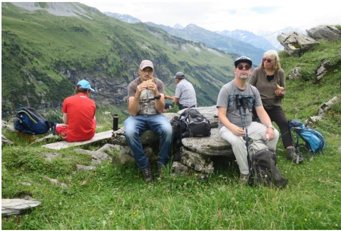
Höhenweg oberhalb des Gentales

kalten See und einem Kaffeehalt in der romantischen Beiz wanderten wir auf dem Höhenweg über fünf Stunden nach Hasliberg Reuti. Diese lange Wanderung war zwar wunderschön und total in der einsamen Natur, doch einige der Gäste kamen an ihre Leistungsgrenze. Wir schafften es und waren froh, dass wir mit der Bahn nach Meiringen runter fahren konnten.