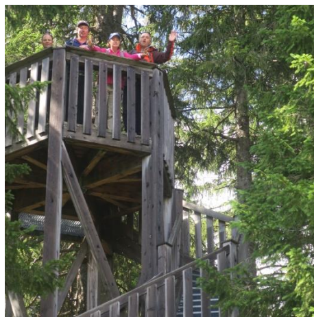
Bärenturm am Moorbäerpfad in Langis