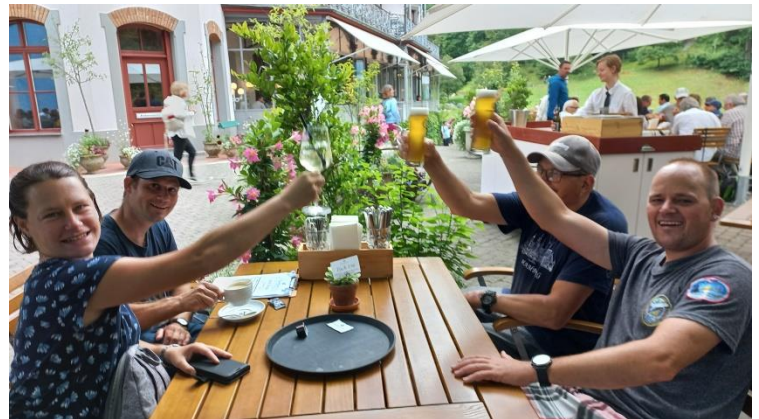
Anstossen beim Restaurant Giessbach

Am letzten Ferientag besichtigten die Gäste die Giessbach-Fälle. Da es im Moment wegen dem Regen der letzten Wochen viel Wasser hat, sind die Wasserfälle sehr spektakulär und gewaltig. Die Wandergruppe stieg hoch hinauf und genoss die wunderbare Sicht auf den Brienzensee und das Hotel Giessbach. Mit dem Schiff ging es danach zurück. Wieder in Brienzwiler genossen alle eine grosse Portion Äplermaggronen mit Apfelmus.