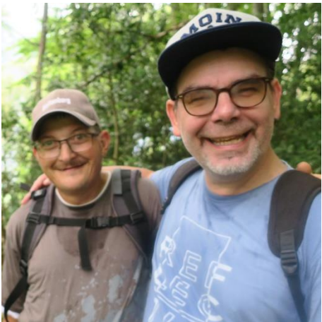
Wanderung nach Brienz

Am nächsten Tag wanderten wir über den Brünig nach Lungern. Die sportlichere Gruppe sogar über den Wyler Vorsass (1300 Meter), die andern direkt zum Brünigpass. Das war steil! Auf dem Brünig Kulm trafen sich alle wieder zu einem Kaffee und stiegen anschliessend gemeinsam nach Lungern ab.