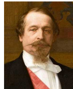
Louis Napoléon Bonaparte (1808-1873)

Mariée à un baron, elle devient une femme indépendante dans les années 1830. Amie de nombreux artistes romantiques (Chopin, Musset), elle écrit des romans et est aussi proche des milieux socialistes dont elle soutient la révolution de 1848. Sous le Second Empire, elle se consacre à son œuvre littéraire et à sa correspondance.