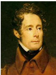
Alphonse de Lamartine (1790-1869)

Aristocrate, poète, il est député dès 1833. Il joue un rôle majeur dans la révolution de février 1848, imposant le drapeau tricolore et devenant Ministre des affaires étrangères. Mais il est dépassé par les événements de juin et est battu aux élections présidentielles de 1848. Il se retire de la vie politique après le coup d'état de 1851.