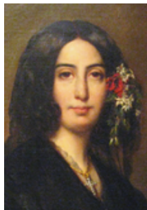
George Sand (1804-1876)

Aristocrate, poète, il est député dès 1833. Il joue un rôle majeur dans la révolution de février 1848, imposant le drapeau tricolore et devenant Ministre des affaires étrangères. Mais il est dépassé par les événements de juin et est battu aux élections présidentielles de 1848. Il se retire de la vie politique après le coup d'état de 1851.