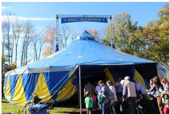
Zirkus Tausendtraum 2014