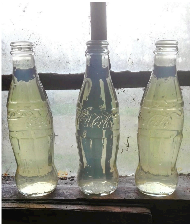
Riestenwater – Vledder Aawaeter – Drentse Aawaoter