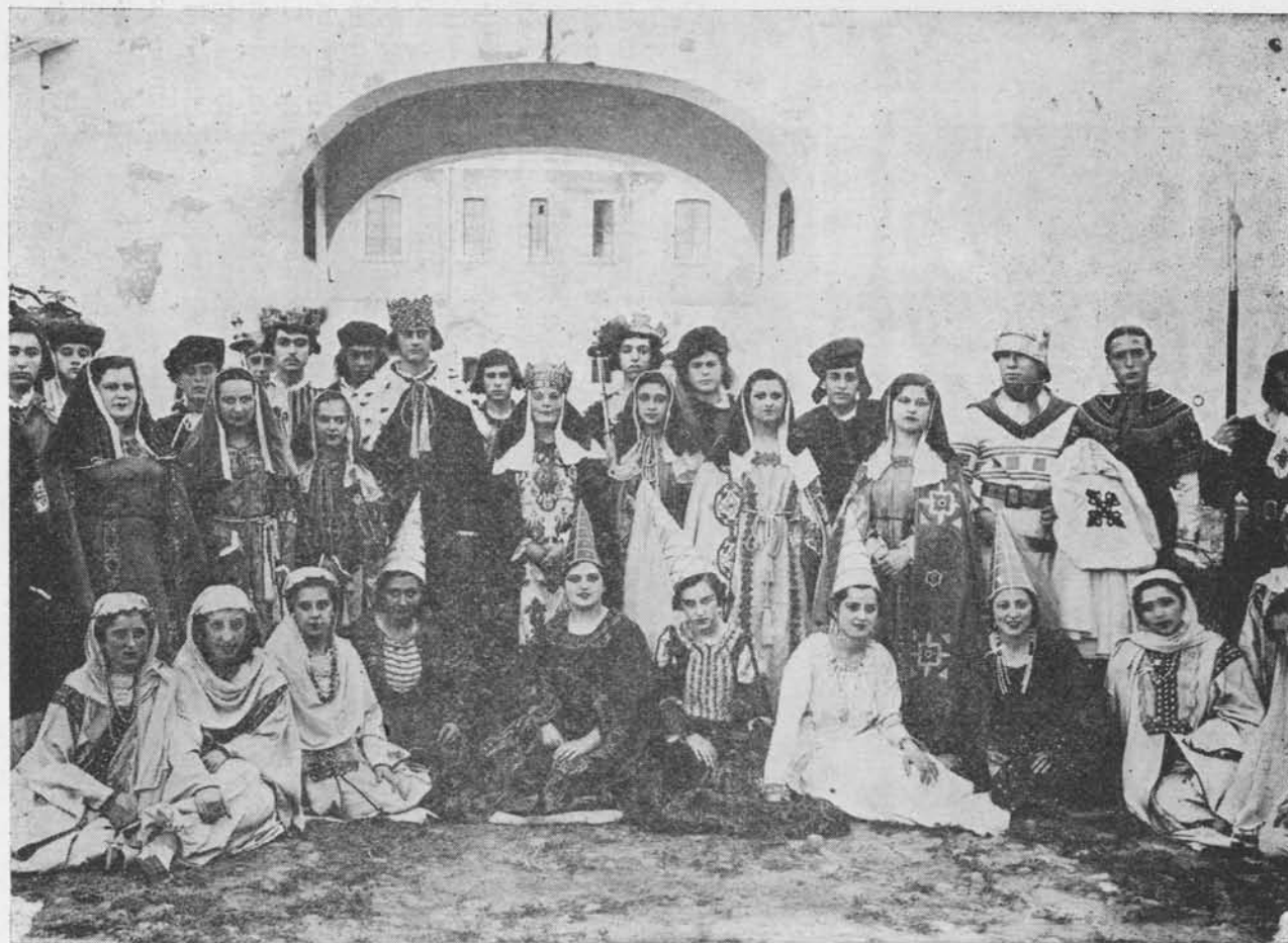
Estudiantes que figuraron en la cabalgata histórica de la Reconquista, al cumplirse el VII Centenario, ataviados a usanza de la época.