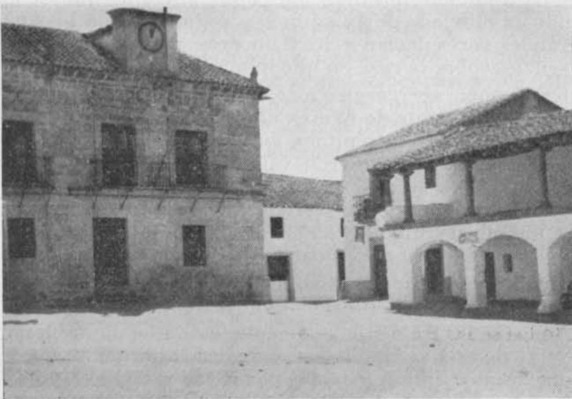
TORREMILANO - CASA AYUNTAMIENTO Y PLAZA

El relato, algo extenso, refiere en síntesis lo siguiente: Al despuntar el día y retirarse las patrullas de Urbanos que vigilaban durante la noche, fueron sorprendidos y hechos prisioneros, dirigiéndose los carlistas con presteza y algarabía hasta el centro de la Plaza, no sin antes poner vigilancia para evitar que pudieran salir emisarios hacia Pozoblanco u otros pueblos. Con rapidez prendieron a las autoridades a las que le dieron órdenes de que «inmediatamente habilitasen cuatrocientas raciones de pan, queso, vino y cebada, como también el que se presentasen en la plaza todos los caballos, armas y monturas».