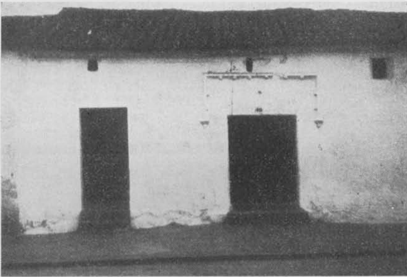
ANTIGUA CASA CONSISTORIAL DE CONQUISTA