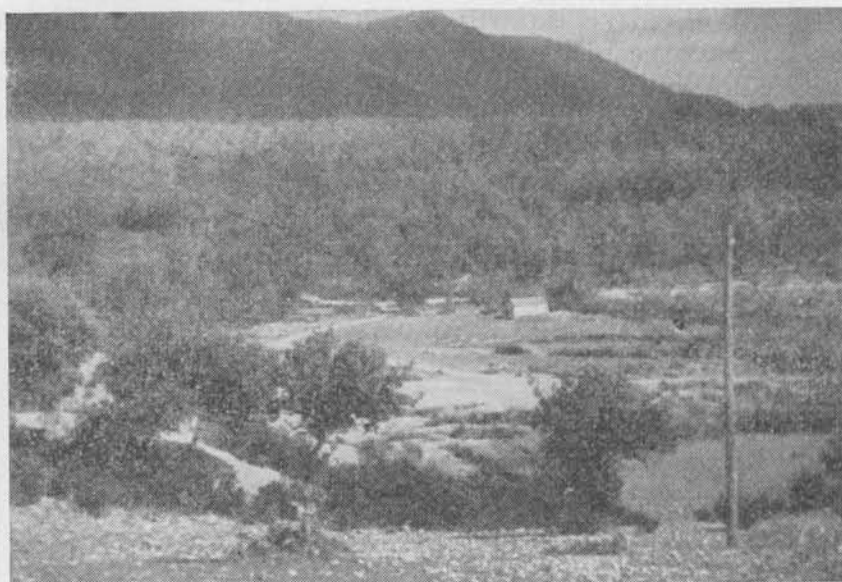
ESTADO ACTUAL DEL LUGAR DONDE COMENZÓ LA LUCHA

Sobre las diez de la noche llegaron las Milicias a La Garganta y esperaron al nuevo día con impaciencia y con la seguridad de la victoria y escarmiento ejemplar, no sin antes haber sorprendido al cen-