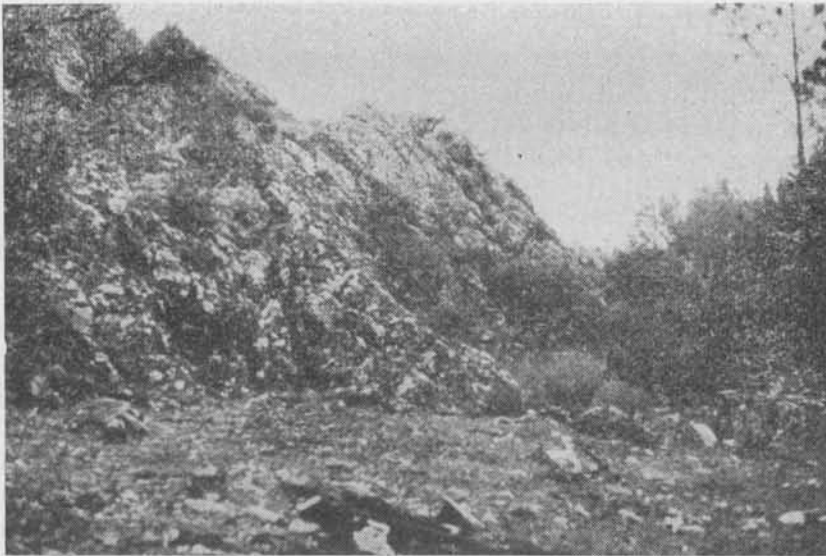
PICACHO DEL LLAMADO AHORA "CERRO DE LOS CARLISTAS"

«Destruídos estos datos —continua diciendo— repuesta la facción en gruesas masas, para nosotros sorprendentes, apoderados de la altura occidental e informados por un espía del corto número que le atacaba, tomaron la ofensiva y hubo necesidad de retirarse, intentando tomar la altura opuesta y haciéndose prodigios de valor, como los del jefe, que se internó en lo más fragoso del monte, donde fué rodeado por 160 hombres. Un grupo igual de numeroso atacó al Comandante de Armas, quien emprendió la retirada por escalones, disputándose el terreno palmo a palmo, mientras el Alcalde Mayor acosado por todas partes y viendo caer a su lado al de Villanueva y otros, sin perder la serenidad pero viendo la imposibilidad de salvarse con los pocos que quedaban de su escolta, trató solo de vender caras sus vidas, hasta que recibiendo un golpe de sable en la cabeza y parte del rostro, quedó fuera de combate y en poder de los enemigos, los que ufanos con tan interesante presa, dieron lugar a que se ocultasen en el monte otros sobradamente apreciables que no abandonaron a su jefe hasta el último momento y que son los que después han referido tan heróico comportamiento. El señor Comandante General que se presentó en aquel momento hizo los mayores esfuerzos para perseguir la facción y rescatar los prisioneros; pero todo fué inútil, pues se retiraron precipitadamente, llevándose al Alcalde Mayor, a un oficial de Urbanos de Villanueva de Córdoba y a dos vagajeros...».