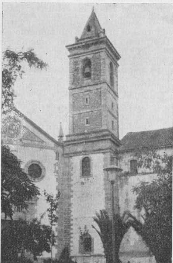
Torre de la Parroquia de Santa Catalina

Hay otras ocurrencias significativas del personaje y de su tiempo. Los cambios políticos, entre otras consecuencias, llevan en nuestra España la necesidad de rotular las calles con nombres de los que ganan. En 1.840, triunfante el Duque de la Victoria, hay que cambiar la rotulación callejera. En Pozoblanco, cómo no, se hace; y el relato de los motivos que explican el nuevo nombre es entretenido y a veces gracioso. Ya se cuenta aparte. Por ejemplo, hay una que se llama la Portería—y aún suena ese nombre—y los Municipales—D. Antonio Félix, según parece— al cambiar la denominación, explican que eso de Portería suena a convento y en Pozoblanco, dicen, «afortunadamente» no hubo nunca convento de frailes. No se piense por tal exabrupto en actitudes anticristianas ni apenas anticlericales, aunque anda por la provincia el diablillo de la lucha religiosa. Otros sucesos aclaran lo religiosidad del personaje.