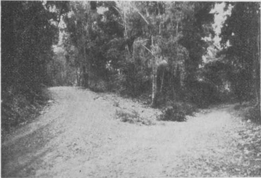
Cruce de los caminos de Fuencaliente y Conquista a La Garganta

a la acción. Apercebido del movimiento el enemigo atacó duramente y con tesón a dicho grupo al objeto de impedirle la llegada a dicha choza y en esta empresa encontró la muerte dicho alcalde con siete individuos más de los que formaban su sección.