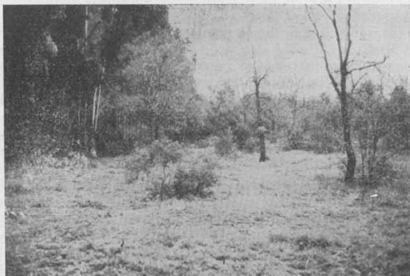
LUGAR DONDE FUERON ENTERRADAS NUEVE VICTIMAS