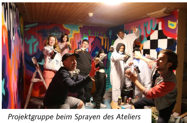
Projektgruppe beim Sprayen des Ateliers

Die Kinder und Jugendlichen dürfen dabei entweder eigene Ideen umsetzen, sich von einem Teammitglied helfen lassen oder einen unserer vielen Kurse besuchen. Das Besuchen der Kurse und die Nutzung des Ateliers sind stets gratis. So kriegen alle Kinder und Jugendlichen der Gemeinde die Chance, sich kreativ und handwerklich auszudrücken. Im 2022 gab es unter anderem einen Tie Dye und einen Bleach Dye Workshop. Weiter konnten sie Fenstermalfarben und Acrylpouring ausprobieren oder Leinwände und Jutebeutel bemalen. Im Sommertreff war besonders das Herstellen von