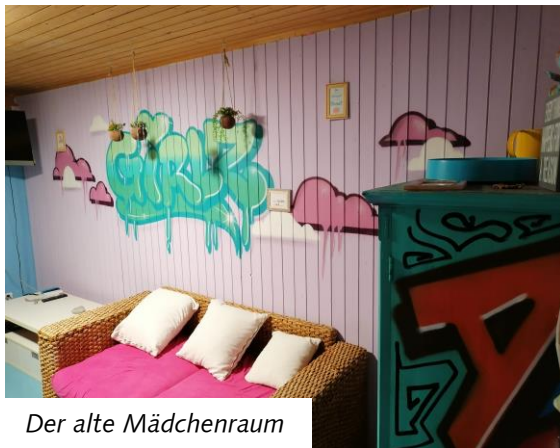
Der alte Mädchenraum