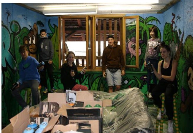
Projektgruppe beim Sprayen des Chillraums

während zwei Tagen die Wände zu besprayen. Die Räume wurden anschliessend nach dem Geschmack der Kinder und Jugendlichen wieder eingerichtet und dekoriert. Zum Abschluss des Projektes wurden die Räume an einem Tag der offenen Türe den Bewohnerinnen und Bewohnern der Gemeinde Schwyz zugänglich gemacht.