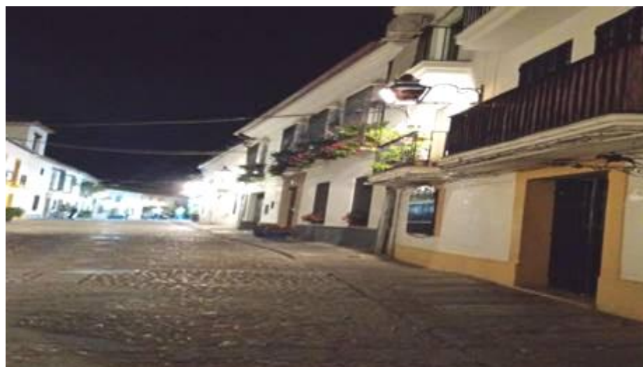
Calle de Córdoba.

A menudo, cuando hablamos de protección del paisaje tanto rústico como urbano, estamos pensando en los espacios de excepcional belleza; pero no sólo son los bienes de valor excepcional los que merecen protección. Es más, espacios urbanos y rústicos como el que conforma la Mezquita de Córdoba, o Doñana o Covadonga ya cuentan con adecuada protección. Corren actualmente mayor riesgo los espacios rústicos y urbanos normales, pero cargados de autenticidad, que llevan en su ser la mano del hombre, que forman nuestra memoria histórica, y son nuestra identidad cultural.