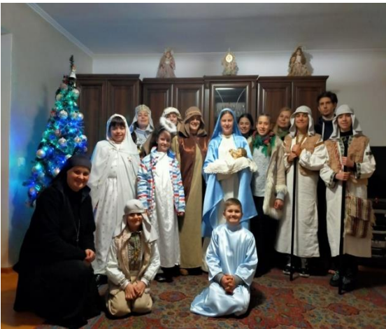
Kinderheim in Iwano-Frankowsk