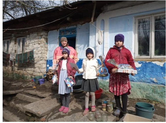
2021 in der Westukraine, Iwano-Frankowsker Gebiet