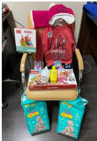
Für eine Frau mit Kleinkind im Gefängnis, Kiew