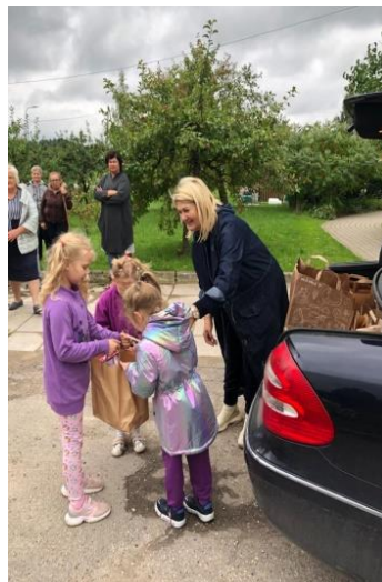
Krisenzentrum in Zante