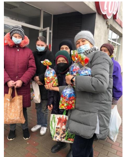
Suppenküche in Tukums