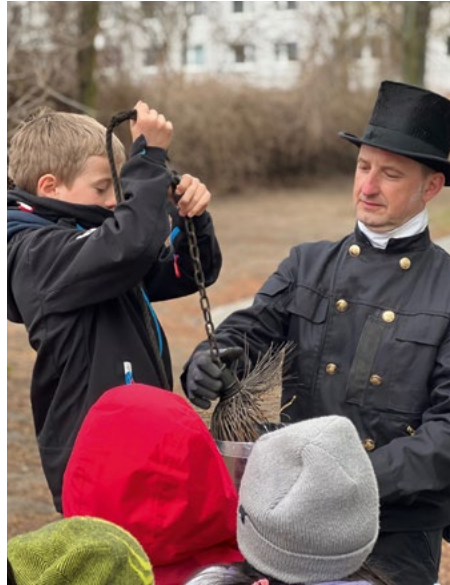
Einmal die Arbeit eines Schornsteinfegers ausprobieren