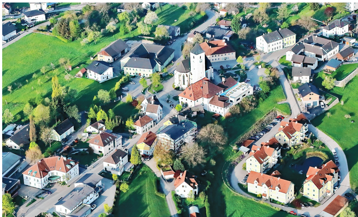
▲ Neue Perspektiven auf das Ybbstal bietet der neue Bildband „Die Ybbs von oben“ von Franz X. Bogner, so auch auf die Gemeinde Allhartsberg.

weist er auf den Eingriff des Menschen in den natürlichen Flusslauf und dessen Folgen hin. Die Sichtweise von oben lädt auch unter diesem Aspekt zu einem Perspektivenwechsel ein.