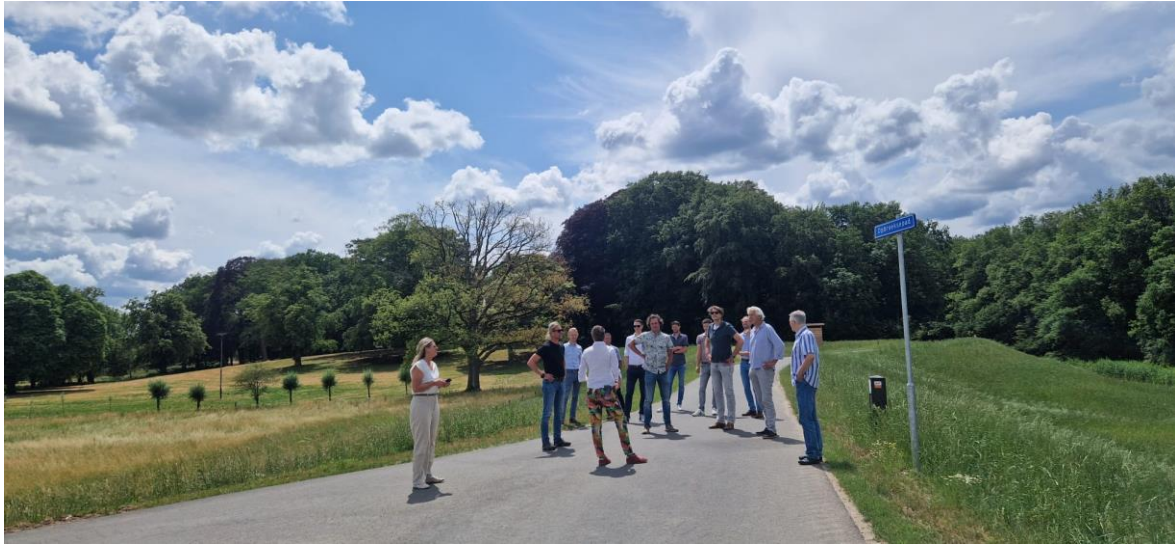
Figuur 3: Veldbezoek afgelopen zomer projectteam WSP en projectteam Hoenwaard 2030

De teamleden hebben zich gedurende de zomer ingelezen en het projectgebied bezocht. U kunt hen vanaf dit najaar tegenkomen bij bijeenkomsten en gesprekken in het gebied. Het projectteam van WSP werkt nauw samen met het projectteam van de vijf samenwerkende overheidsorganisaties.