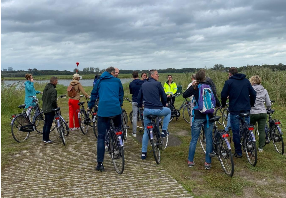
Figuur 4: Op diverse plekken in het gebied werd uitleg gegeven.

Dinsdag 19 september stond in het teken van een veldbezoek van het projectteam Hoenwaard 2030. Tijdens deze dag stond kennisuitwisseling centraal. Het projectteam is door het projectgebied heen gefietst waarbij aandacht uitging naar de verschillende deelgebieden en de bijbehorende gebiedskenmerken.