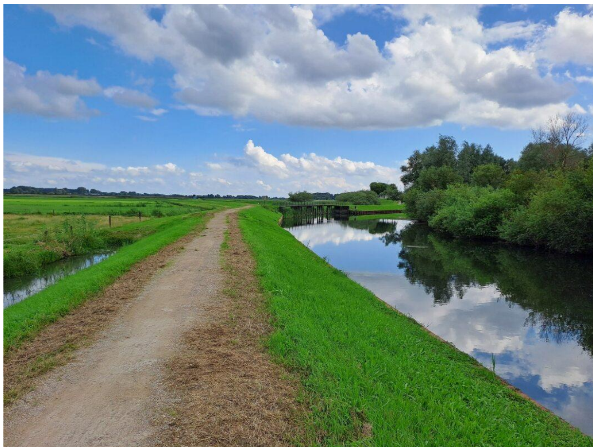
Figuur 1: Hoenwaardkade met Hoenwaardse Wetering (links) en Apeldoorns Kanaal (rechts).