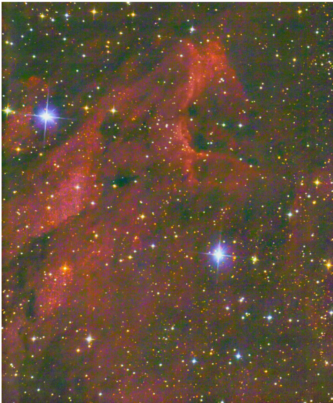
IC 5070 Pelikan Nebel Aufgenommen mit einem 150/750 Newton und der Skywatcher EQM 35 Montierung. 70 Aufnahmen mit Iso 800, Zeiten zwischen 30 und 120 Sekunden.