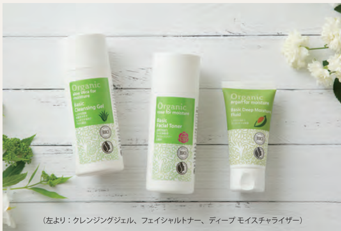
(左より：クレンジングジェル、フェイシャルトナー、ディープモイスチャライザー)

軽い使用感で角質にすっと浸透して、しっかり保湿する頼もしいクリーム。オーガニックのアルガンオイルやシアバターがお肌を保護します。