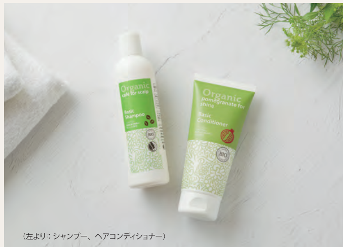
(左より：シャンプー、ヘアコンディショナー)