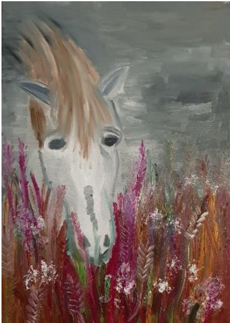
„Pferd im Nebel“ - Öl auf Leinwand - 70 x 50