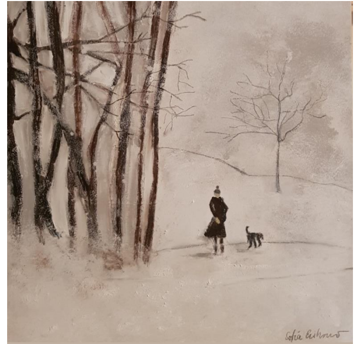
„Winterabend“ - Kohle und Öl auf Leinwand – 60 x 60