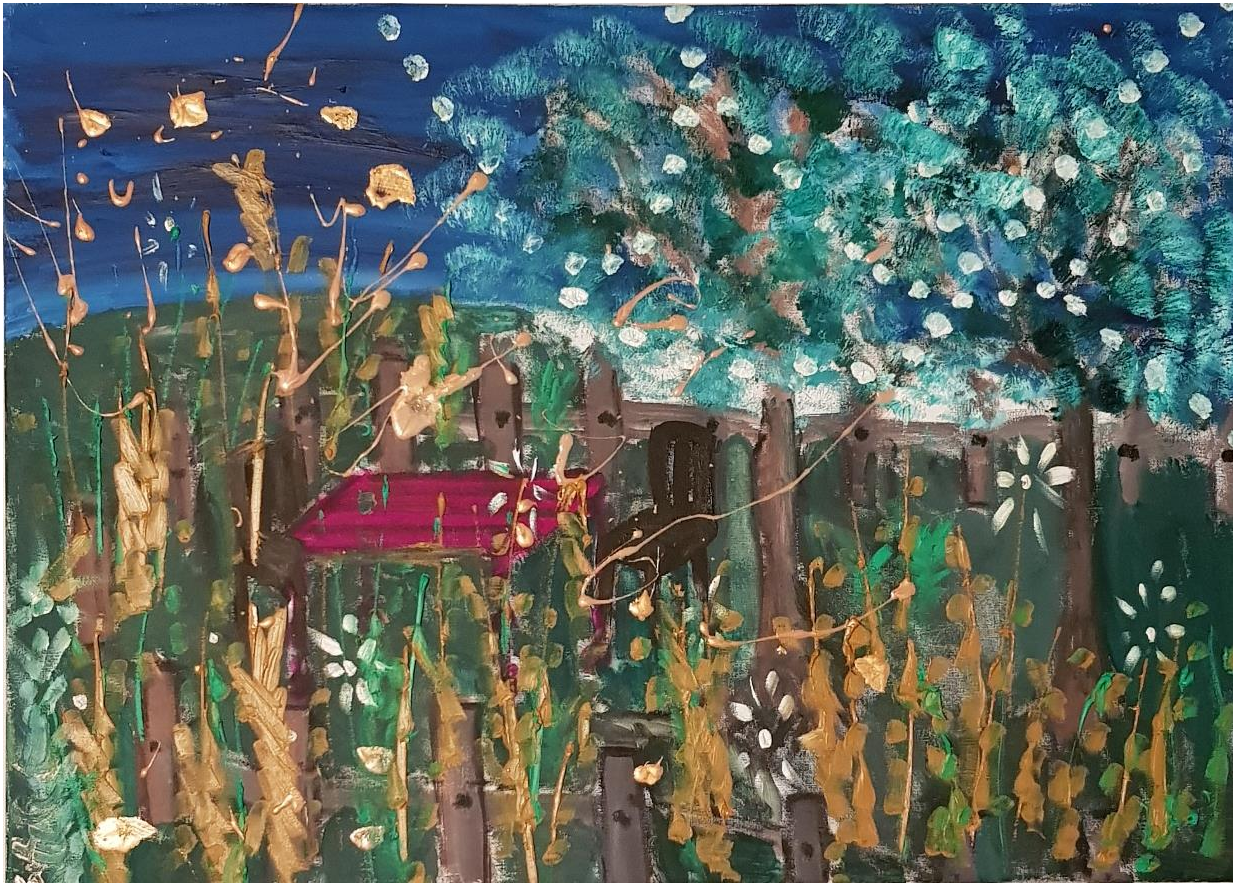
„Gartenromantik“ - Öl auf Leinwand - 70 x 50