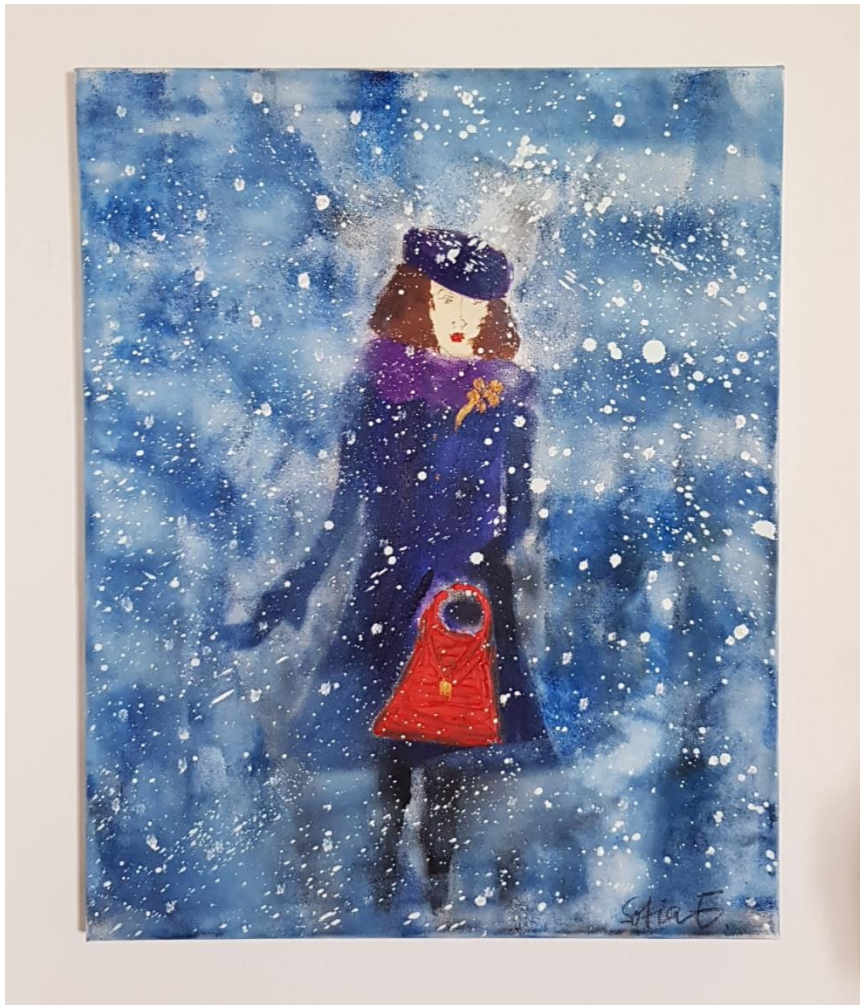
„Winter 1951“ - Öl auf Leinwand - 40 x 50