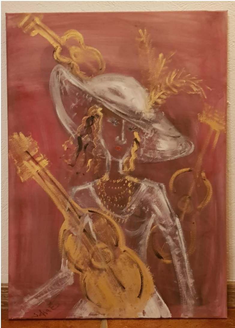
„Die Muse“ - Öl auf Leinwand - 70 x 50