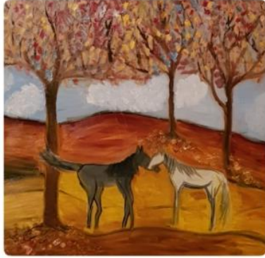
Ausschnitt aus „Pferdeliebe“ - Öl auf Leinwand - 100 x 100