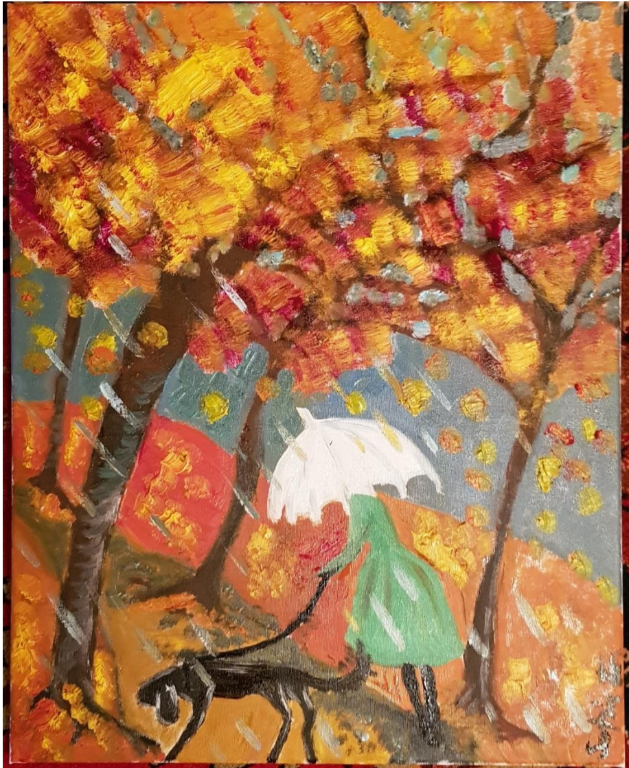
„Dame mit weißem Schirm“ - Öl auf Leinwand - 50 x 60