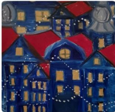
Ausschnitt aus „Dezember“ - Öl auf Leinwand - 60 x 50