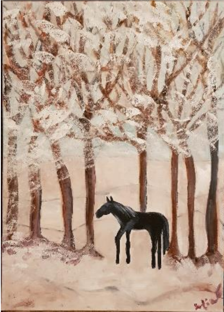
„Stille“ - Öl auf Leinwand - 70 x 50