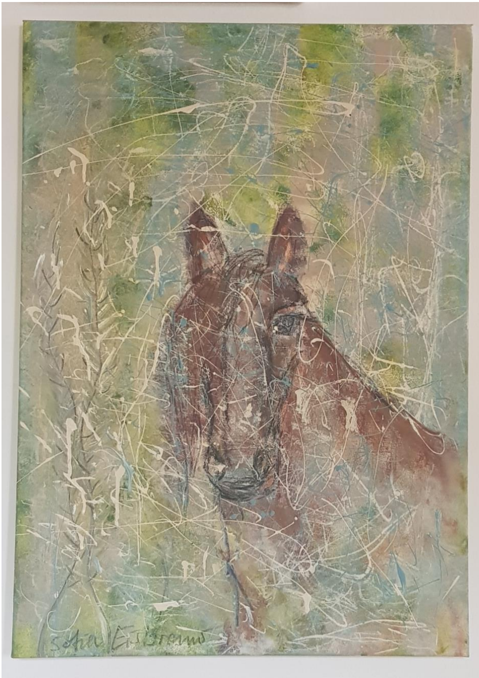
„Sommerpferd oder der Duft vom frischen Gras“ – Mischtechnik, Öl, Kohle auf Leinwand - 70 x 50