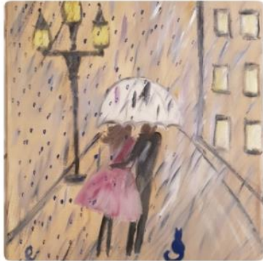
Ausschnitt aus „Liebesregen“ - Öl auf Leinwand - 60 x 50