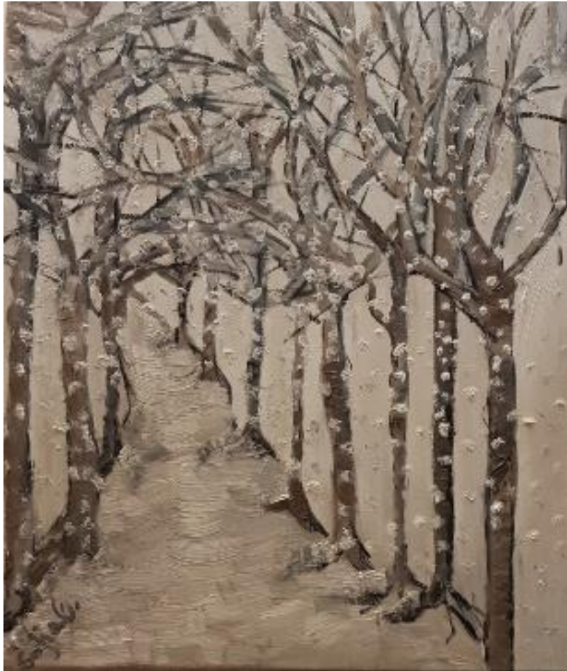
„Schneefall“ - Öl auf Leinwand - 60 x 50