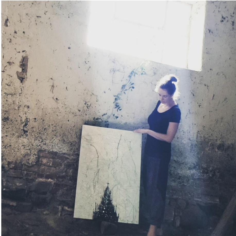
„Kirche im Schneegestöber“ - Kohle und Öl auf Leinwand - 70 x 100