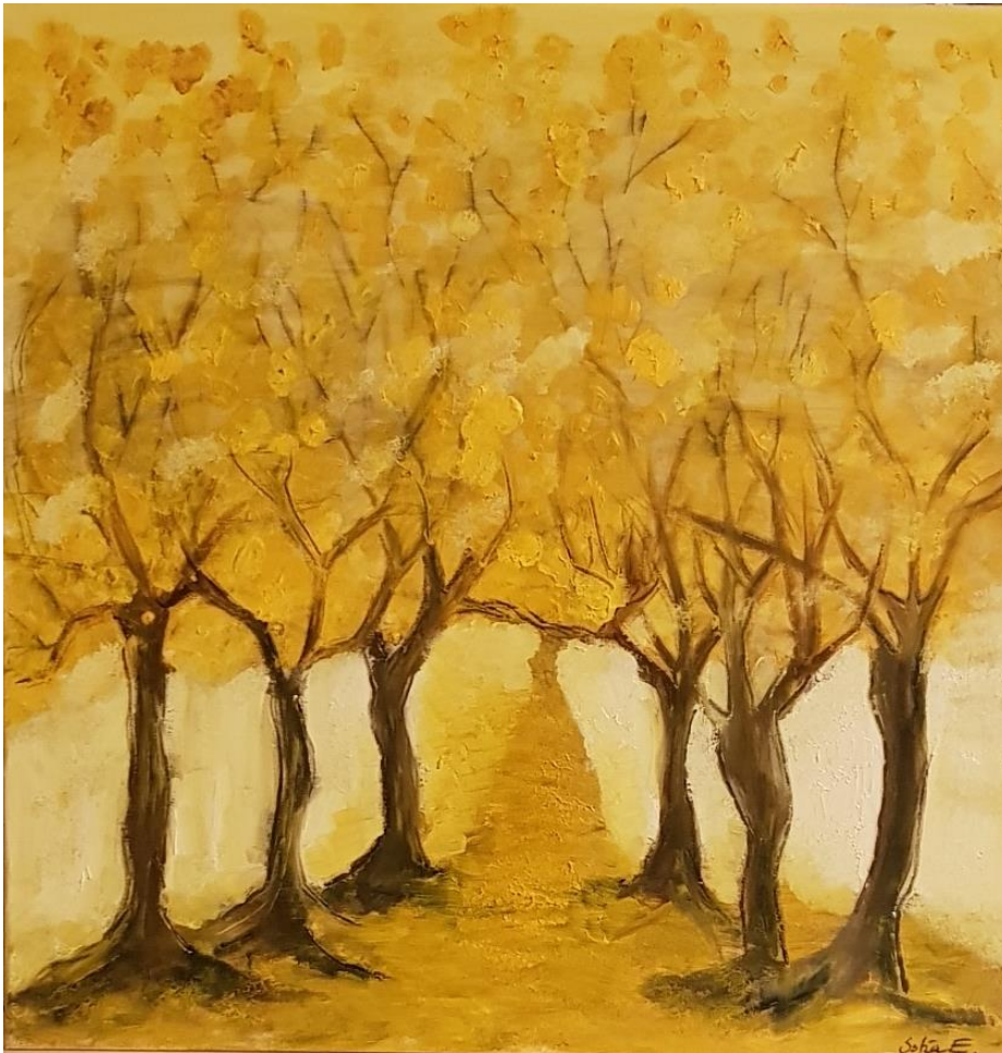
„Ein Tag im April“ - Kohle und Öl auf Leinwand - 60 x 60