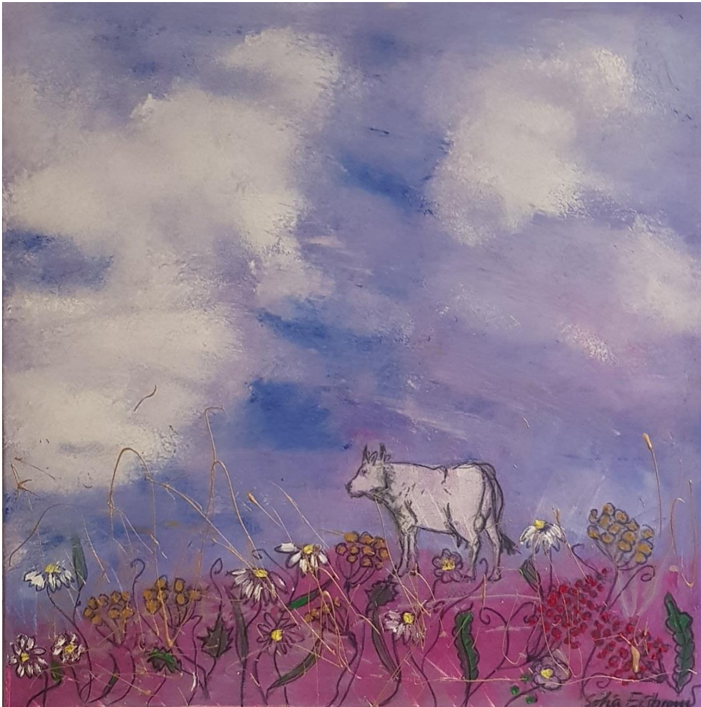
„Weiße Kuh am Anfang der Neuen Welt“ - Öl auf Leinwand - 70 x 50