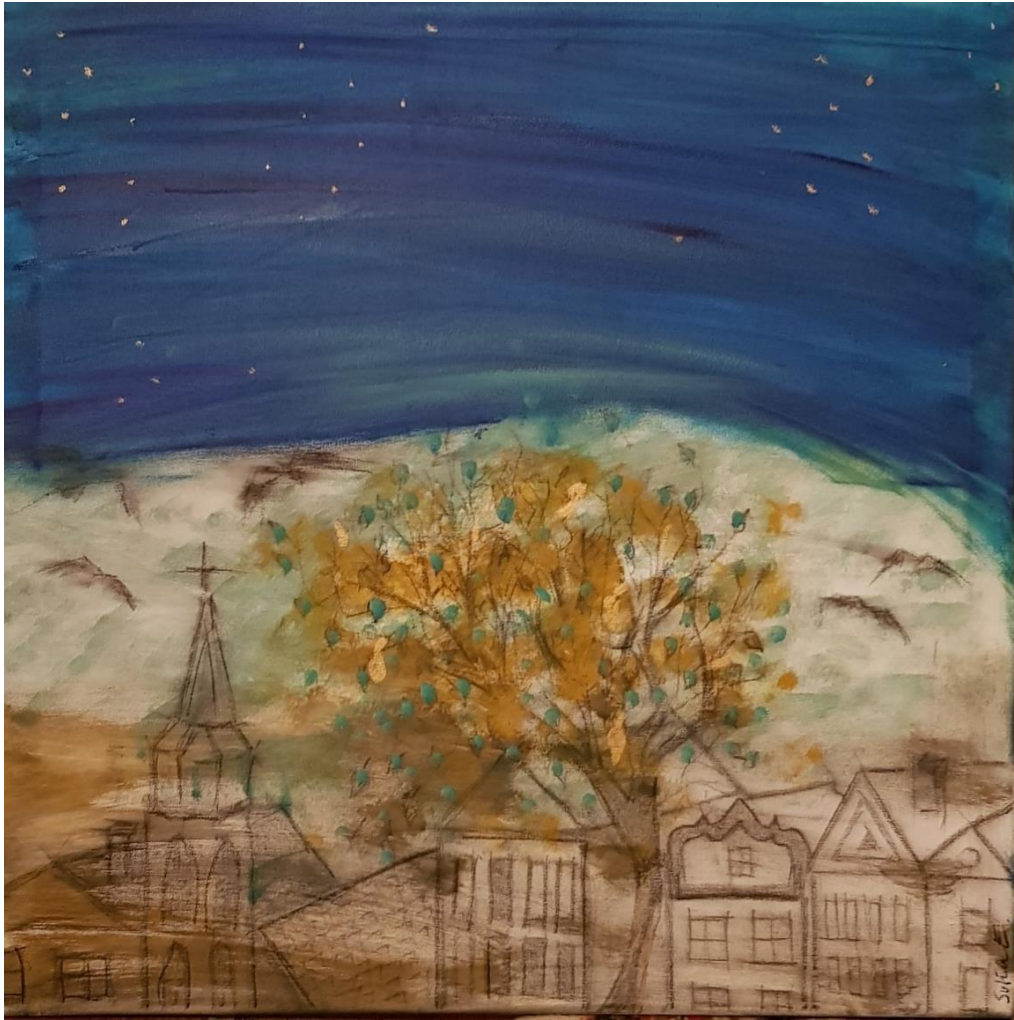
„Frühe Nacht“ - Öl, Kohle auf Leinwand - 60 x 60

КОЛЫБЕЛЬНАЯ - Wiegenlied (Rosenbaum / dt. Text: Tino Eisbrenner)