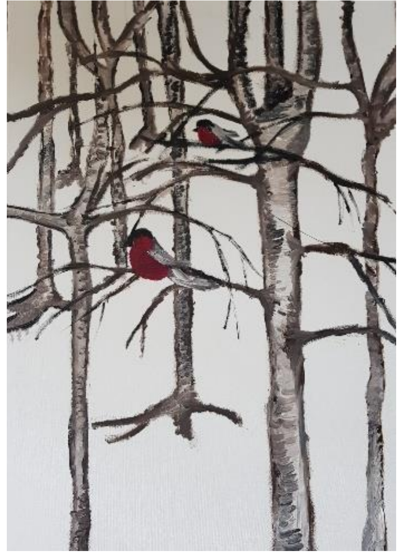
„Zwei Gimpel“ - Öl auf Leinwand - 70 x 50