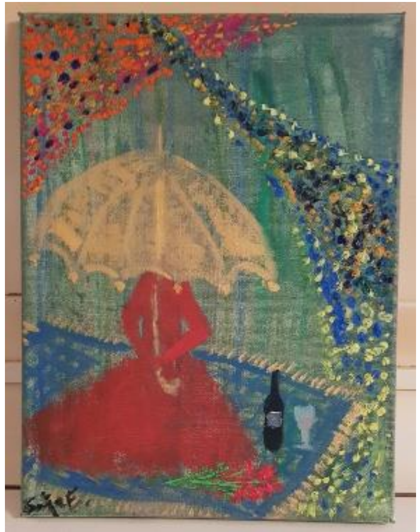
„Picknick einer Unbekannten mit goldenem Schirm“ – Öl auf Leinwand – 50 x 40