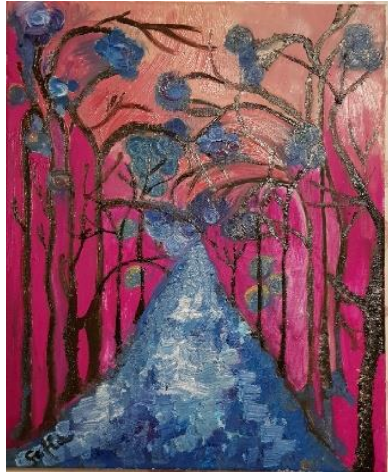
„Der purpurne Herbst“ - Öl auf Leinwand - 60 x 50