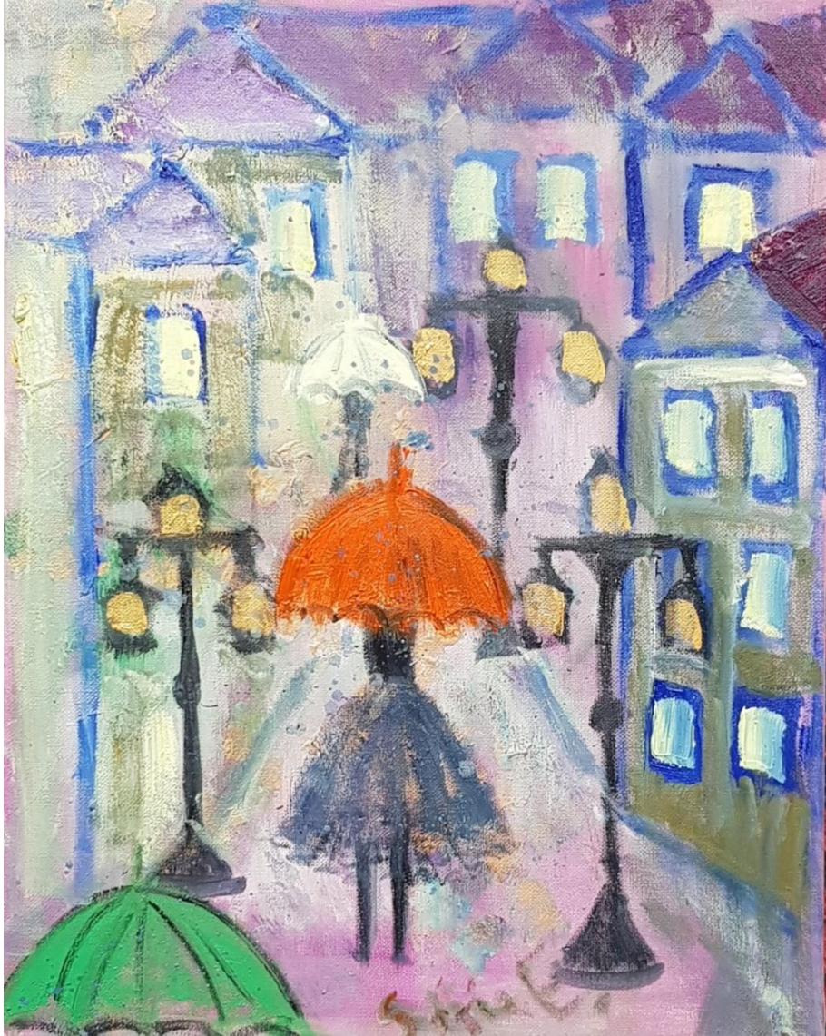
„Sommerregen“ - Öl auf Leinwand - 50 x 40