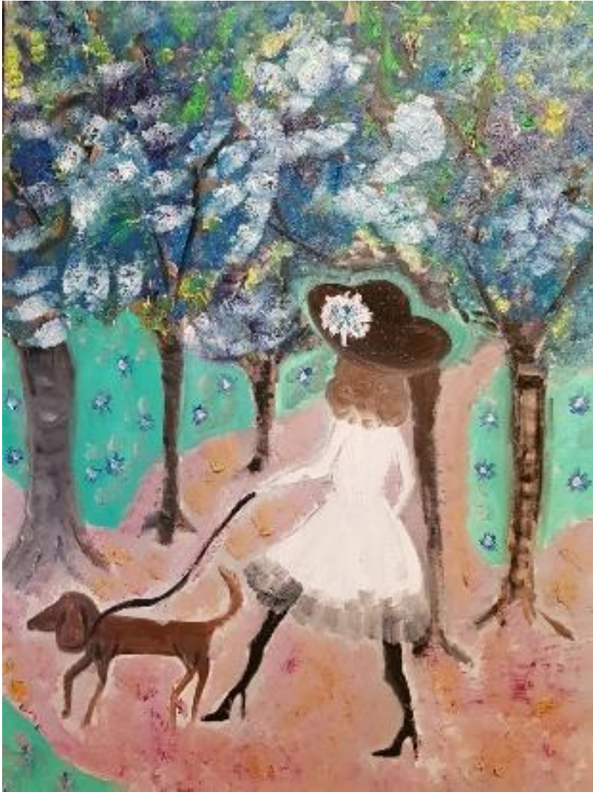
„Dame mit großem Hut im blauen Park“ - Öl auf Leinwand - 80 x 60