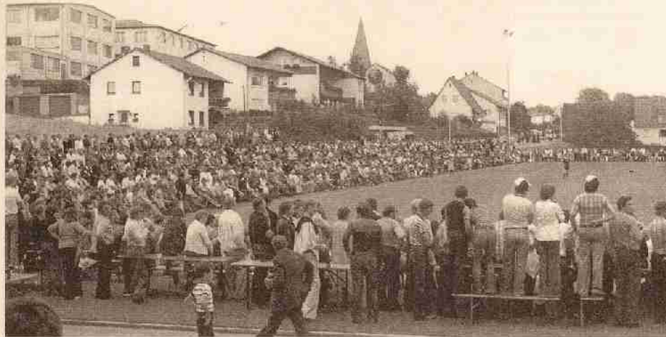
Oben und unten: Der Deutsche Rekord-Fußballmeister 1. FC Nürnberg besiegte in einem Freundschaftsspiel anlässlich der Sportplatzweihe in Untersiemau den Bezirksligisten VfL Frohnlach mit 7 : 1