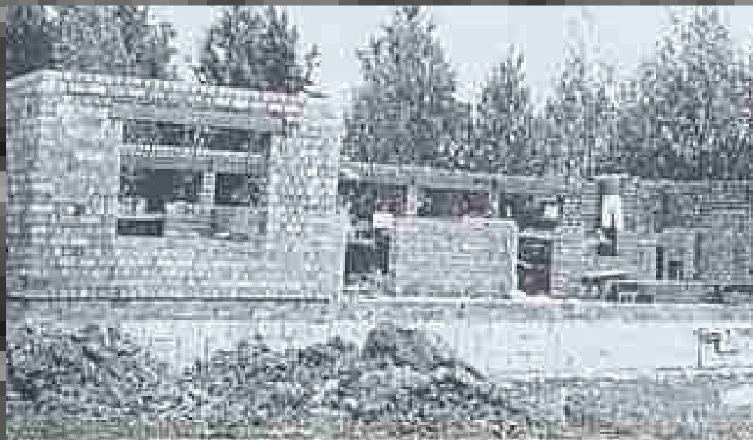
1964: Der Grundstein des TSV-Vereinsheim wird gelegt