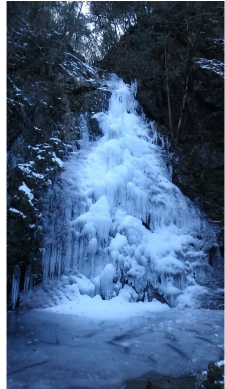
左 2022年2月 右 2018年の結氷