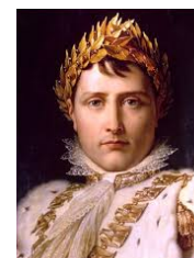
Napoléon Bonaparte (1769-1821)

Petit-fils de Louis XV, roi en 1774, il accepte de réunir les États généraux en 1789 mais se rallie difficilement à la monarchie constitutionnelle. Sa tentative de fuite et son attitude ambiguë face à la guerre accroissent son impopularité. Il est détrôné le 10 août 1792, jugé puis condamné et exécuté le 21 janvier 1793.