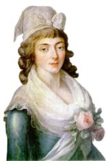
Manon Roland (1754-1793)

Fille d'un graveur, elle reçoit une éducation très poussée et épouse, en 1780, Jean-Marie Roland de La Platière, chef du futur parti girondin, qui devient Ministre de l'Intérieur en 1792. Soutenant la carrière de son mari, elle reçoit dans son salon les députés girondins. Elle est victime montagnarde et est exécutée le 8 novembre 1793.