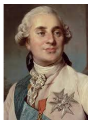
Louis XVI (1754-1793)

Fille d'un graveur, elle reçoit une éducation très poussée et épouse, en 1780, Jean-Marie Roland de La Platière, chef du futur parti girondin, qui devient Ministre de l'Intérieur en 1792. Soutenant la carrière de son mari, elle reçoit dans son salon les députés girondins. Elle est victime montagnarde et est exécutée le 8 novembre 1793.