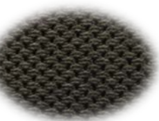
Forro de cuello transpirable