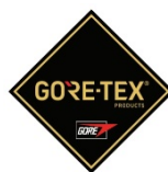
Membrana del forro impermeable + transpirable