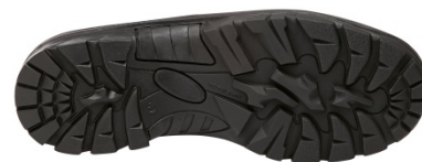
Suela confortable de poliuretano