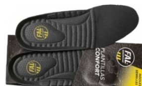
Plantillas extraíbles. Lavable