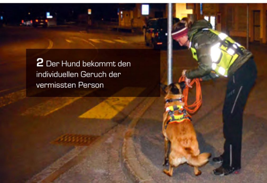
2 Der Hund bekommt den individuellen Geruch der vermissten Person