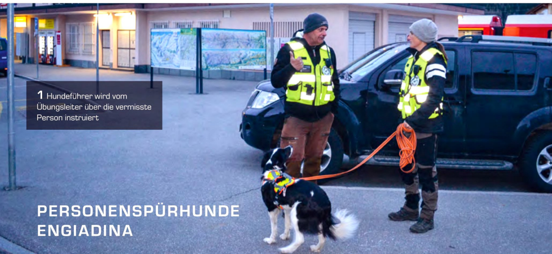
1 Hundeführer wird vom Übungsleiter über die vermisste Person instruiert