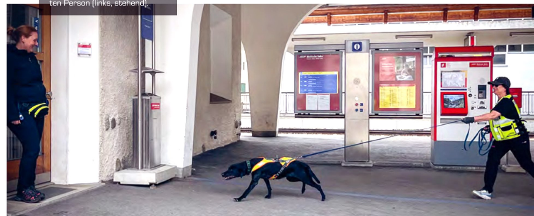
4 Der Personenspürhund kurz vor dem Auffinden der vermissten Person (links, stehend).

Personenspürhunde finden in verschiedenen Bereichen Anwendung. In der Suche und Rettung können gut trainierte Personenspürhunde vermisste Personen im unwegsamen Gelände oder in städtischen Gebieten aufspüren. In der Forensik können Personenspürhunde bei der Aufklärung von Verbrechen helfen.