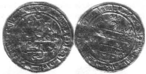
Dinar del año 408 H. de al-Qāsim Foto nº 18.