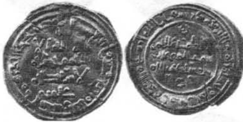
Dirham ʿAbd al-Raḥmān V. 414 H. (Foto nº 20).

A pesar del corto espacio de tiempo que duró su gobierno, se conoce una moneda de plata acuñada por este califa de la colección Tonegawa que nos confirma su mandato. (Foto nº 20).