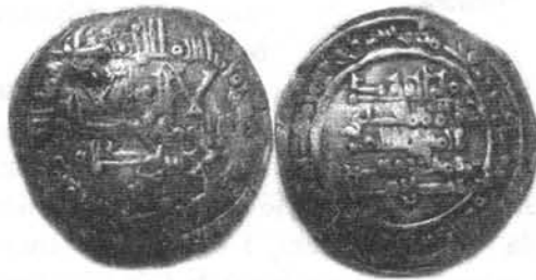
Dirham acuñado por Yahyā en el año 417 H. Foto nº 19.