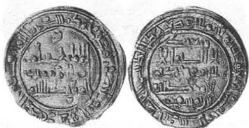
Dirham y dinar del segundo reinado de Hišām II del año 403 H. Fotos nº 13 y nº 14.

El 4 por pasar awwāl del 403 (8 mayo 1013) los cordobeses sufrieron una grave derrota y el qādī Ibn Dakwān se presentó ante Sulayman pidiendo el aman para los cordobeses que les fue concedido al hacer un fuerte pago de dinero.