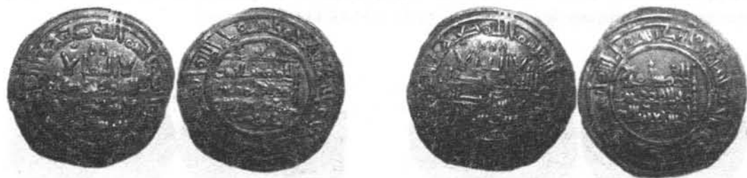
Dirhams de Sulayman del año 400 H. de ceca el 1º M. al-Zahrā` y el 2º al-Andalus foto n° 7 y 8.

Muḥammad II entra en Córdoba, iniciando su segundo gobierno, persigue a los beréberes y es derrotado en el Wādī Aro el 6 de ḡū-l-qa`da del año 400 (20 de junio 1010), vuelto a la capital, mandó cavar un foso y erigir un muro inmediato a la ciudad, poco después el 8 de ḡū-l-ḥiŷŷa (22 de julio) es asesinado en Córdoba volviendo a colocar de califa a Hišām II que reinó hasta el 403 H teniendo como ḥāyib al fata Wāḍiḥ.