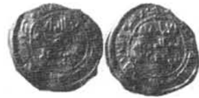
1/3 dinar de Hišām III año 418 H. (Foto nº 22).