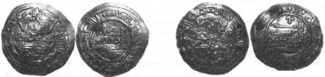
Dirhams de Muḥammad II el 1º de la 2ª mitad del año 399H y el 2º del año 400 H. fotos nº5 y 6.

Como confirmación de estos acontecimientos vemos como durante el año 399 H. las acuñaciones de monedas llevan en los primeros meses el nombre del califa Hišām II (fotos 3ª y 4ª) y en la segunda mitad las acuñaciones cambian de califa apareciendo en ellas Muḥammad II. (foto 5 y 6).