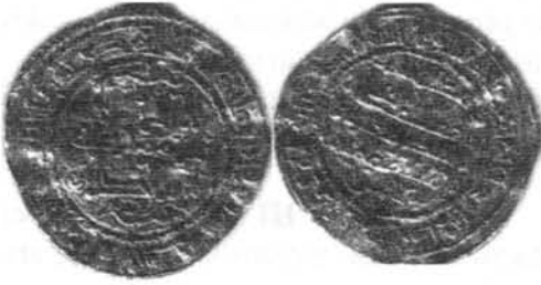
Dinar del 407H. de `Alī b. Ḥammūd Foto 17.

Como testimonio de este gobierno adjuntamos la foto de un dirham del año 417. (Foto nº 19).