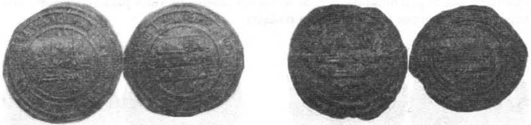
Dinar y dirham de Sulayman del año 404 H. Fotos nº 15 y nº 16.

Al preguntar por al-Muʿayyad solo pudieron comprobar que había fallecido al examinar su cadáver. Seguidamente hizo traer a al-Mustaʿin y a los suyos que fueron decapitados el domingo quedando 9 días del mes de muḥarram del año 407 (17 de junio del 1016).