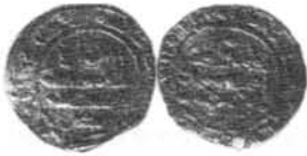
1/3 dinar Muḥammad III 415H MAN Cruz Conde (Foto nº 21).

Hišām III al-Mu'tadd , era hermano de al-Murtaḍā fue jurado previo acuerdo entre los cordobeses y los habitantes de la frontera en el castillo de al-Bunt el 5 por pasar rabī' II 418 ( 2 junio 1027) llegando a Córdoba el 8 de dū-l-ḥiyyā del año 420 (17 de diciembre del 1029) en una pobre comitiva. Su visir Ḥakam b. Sa'id el Sedero apodado "Padre del pecado" fue asesinado porque gobernaba tiránicamente y se apoderaba de los bienes de los comerciantes por lo que los cordobeses encerraron en la cárcel a al-Mu'tadd y lo depusieron el 2 dū-l-ḥiyyā 422 (19 de noviembre del 1031) (Kamil pág. 367/8), fecha de la abolición del califato de Córdoba.