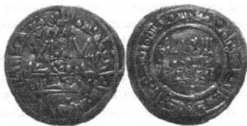
Foto nº 9 dirham de Hišām II del año 400H.

Durante los años 401 y 402 H., las acuñaciones están realizadas por Hišām II (fotos 10 y 11), no obstante a partir del año 402, también aparecen algunas raras monedas acuñadas probablemente por gobernadores independizados en las cuales se cita como califa a Sulayman, en ellas la ceca indicada es la de al-Andalus a pesar de no tener bajo su jurisdicción la capital de Córdoba; son el principio del periodo de los reinos de Taifa que siguió al califato de Córdoba (foto 12) (MACO Edif.. Icaro).