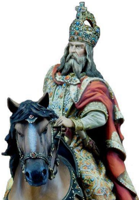
Kárl der Große