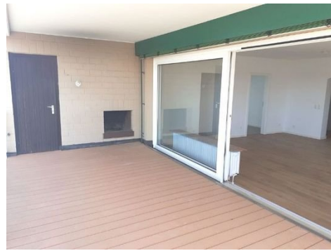
Terrasse Bild 3