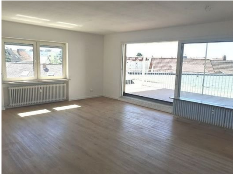
Wohnen-Essen Bild 1