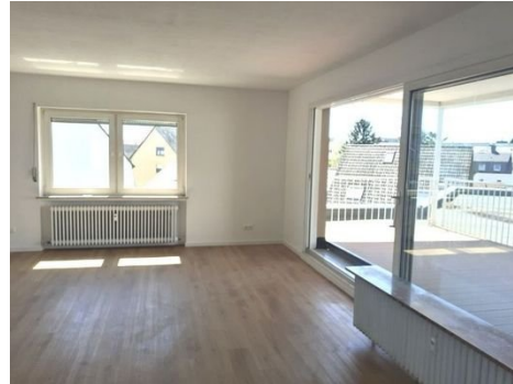
Wohnen-Essen Bild 2