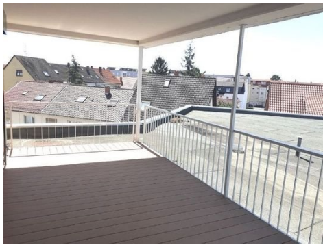
Terrasse Bild 2