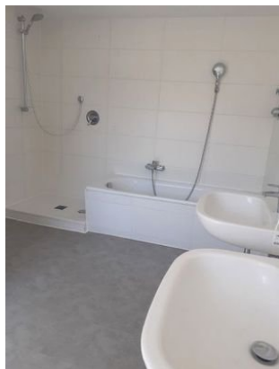
Bad Bild 2