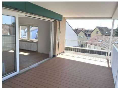
Terrasse Bild 1