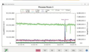
付属IMSソフトウェアPC画面

パーソナルコンピュータと接続し、カウンタを直接操作・データダウンロード・グラフ作成。