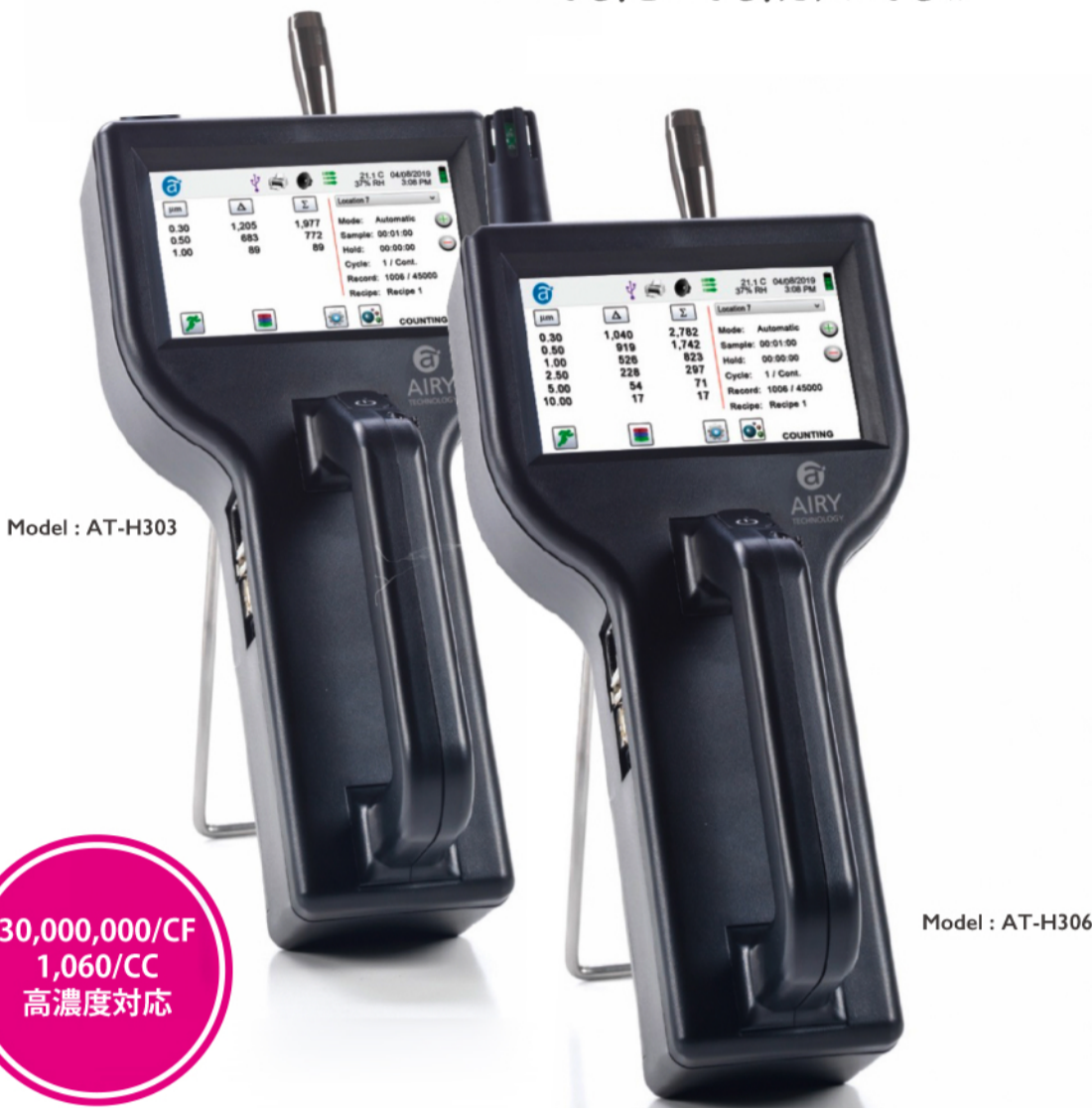
Model : AT-H303