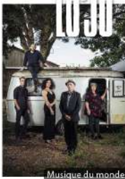
Musique du monde

La bande à Lo'Jo, une caravane musicale aux influences multiples qui voyage autour des rythmes du monde et des harmonies universelles. Chamannique, polyglotte, épique. Des saveurs d'épices aux fiestas, bivouacs aux effluves Tziganes, du blues berbère au swing africain. Une musique nomade, belle et sauvage.