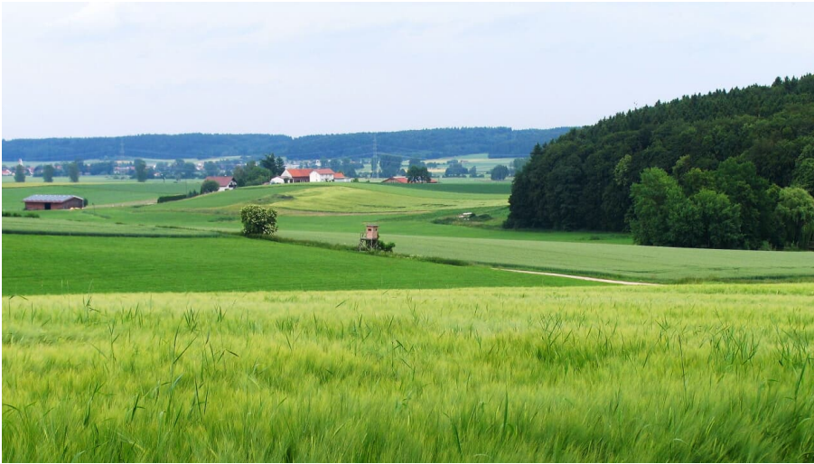
Mariensteig-Tour zwischen Kellmünz und Altenstadt