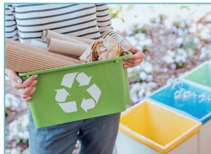
Bacs de tri