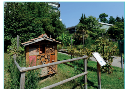
Hôtels à insectes

Grand Est ALSACE CHAMPAGNE-ARDENNE LORRAINE