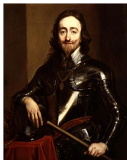
Charles I er (1494-1547)

Roi d'Angleterre, d'Irlande et d'Écosse de 1625 à 1649, auquel le Parlement s'oppose parce qu'il veut augmenter ses revenus et parce qu'il interfère dans les affaires religieuses de l'Église anglicane. Il est alors perçu comme un tyran. Il est vaincu lors des deux guerres civiles et est jugé et exécuté pour haute trahison en 1649.