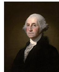
George Washington (1638-1715)

Philosophe et écrivain français, il est le principal représentant du mouvement des Lumières en France. Son influence est décisive sur la bourgeoisie avant la Révolution française. Il est opposé au fanatisme religieux de son époque et est partisan d'une monarchie modérée et libérale, sur le modèle anglais.