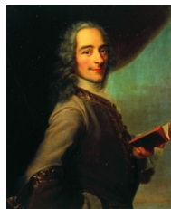
François Marie Arouet (Voltaire) (1572-1610)

Roi d'Angleterre, d'Irlande et d'Écosse de 1625 à 1649, auquel le Parlement s'oppose parce qu'il veut augmenter ses revenus et parce qu'il interfère dans les affaires religieuses de l'Église anglicane. Il est alors perçu comme un tyran. Il est vaincu lors des deux guerres civiles et est jugé et exécuté pour haute trahison en 1649.