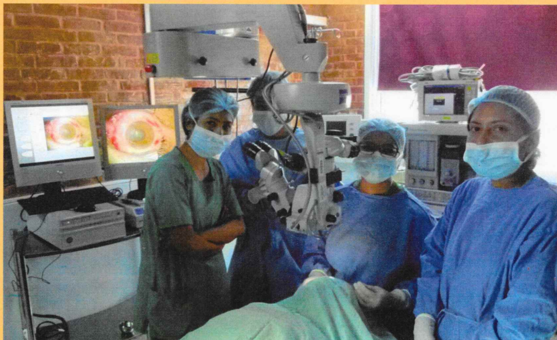
Microscope opératoire "Zeiss" avec système camera/vidéo pour l'enseignement

Salle d'opération pour la cataracte et oculoplastie (chirurgie autour de l'oeil)