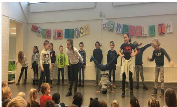
Groep 3 in actie

Op vrijdag 8 februari sloten we het tweede Reggio thema af met dansvoorstellingen. Alle groepen hebben tijdens het thema wekelijks dansles gehad van docenten van het Centrum voor de Kunsten.