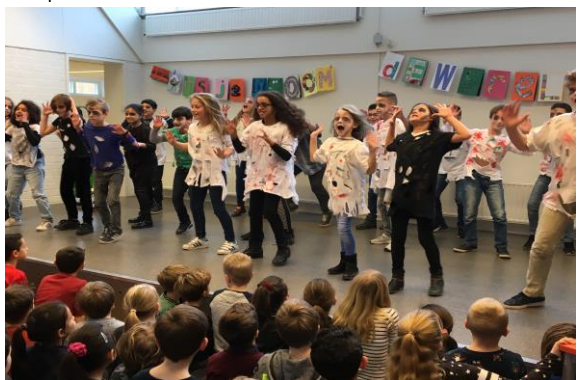
Groep 6 in actie

Het waren mooie voorstellingen. Soms ontroerend om de allerkleinsten al zo vrij te zien bewegen. De midden- en bovenbouw lieten zien dat ze al danservaring hebben en de vonken spatten er af! Bijzonder was het optreden van groep 8 met "I have a dream".