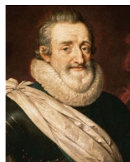
Henri IV (1572-1610)

Roi de France de 1515 à 1547, il s'entoure d'humanistes et appelle en France des artistes italiens pour diffuser leur art. Par ce mécénat, il cherche à accroître le rayonnement de la monarchie française. Par l'ordonnance de Villers-Cotterêts (1539), il fait du français la langue de la justice et de l'administration.