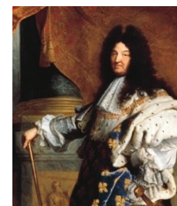
Louis XIV (1638-1715)

Roi de Navarre, protestant et beau-frère du roi de France Henri III, il lui succède en 1589, quand ce dernier est assassiné. Les catholiques ne veulent pas d'un roi protestant. Henri IV se convertit et est sacré en 1594. En 1598, il signe l'édit de Nantes qui donne la liberté religieuse aux protestants mais il est assassiné en 1610.