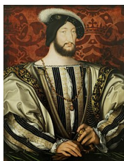
François I er (1494-1547)

Roi de France de 1515 à 1547, il s'entoure d'humanistes et appelle en France des artistes italiens pour diffuser leur art. Par ce mécénat, il cherche à accroître le rayonnement de la monarchie française. Par l'ordonnance de Villers-Cotterêts (1539), il fait du français la langue de la justice et de l'administration.