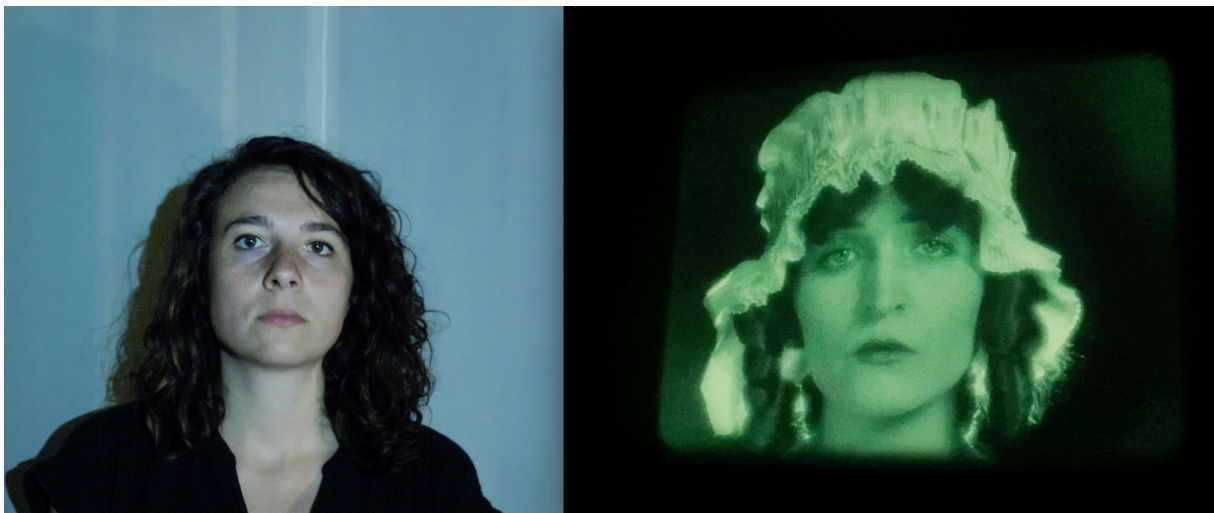
Notre Charlotte Corday de FRUCTIDOR et la Charlotte Corday d'Abel Gance

Une pièce accessible à tous, vive, ludique, nerveuse, politique. Un tourbillon du langage. Un foisonnement construit autour du geste de Charlotte Corday (le meurtre de Marat), de l'arrachement qu'il représente, de sa dimension théâtrale et de ce qu'il pose : la question éminemment urgente et dramatique du renversement de l'ordre des choses.