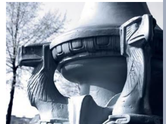
Jugendstil am Friedrichsplatz