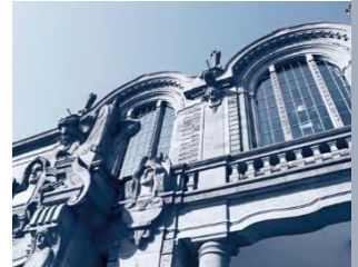
Friedrichsplatz und Rosengarten