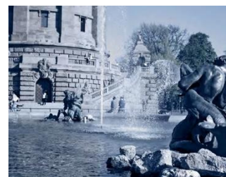
Viktortium und Wasserturm