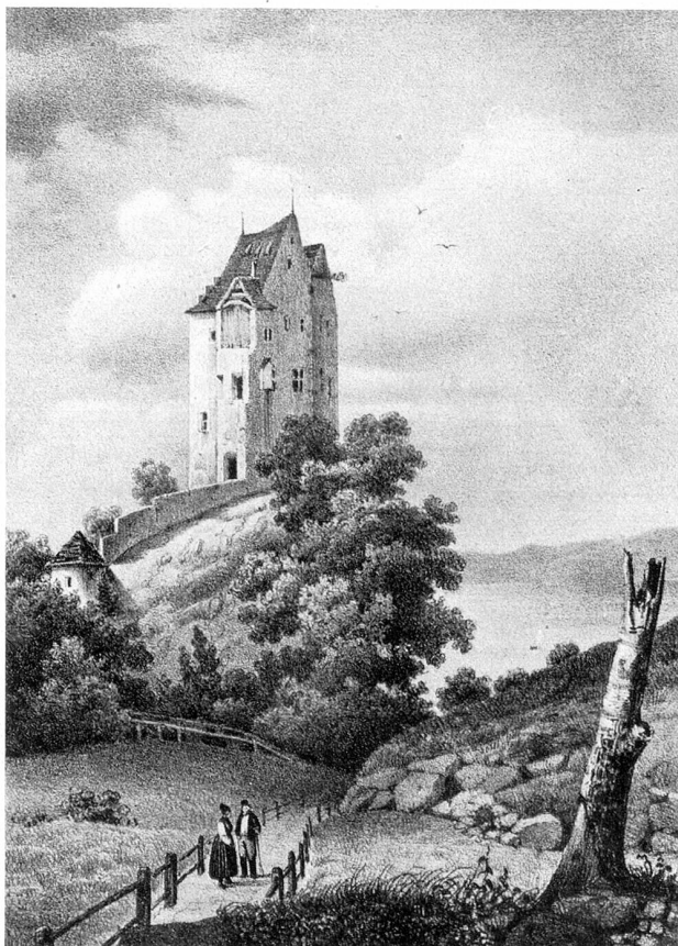
Schloß Salenstein nach dem Abbruch des Südteils (1828)