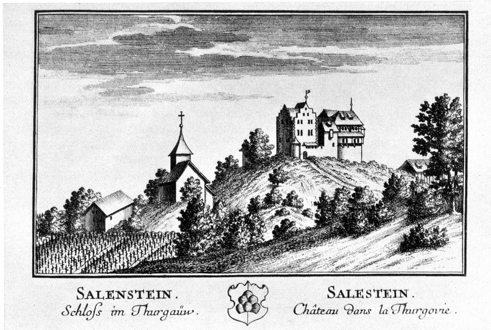
Schloß Salenstein von Nordwesten, 1754. Stich von David Herrliberger

und Bernang vor der im Untersee gelegenen Insel Reichenau vorüber, auf einer lustigen Höhe, von anmutiger Aussicht wohlgelegen, waren vormalen die Wohnung der Edlen von Salenstein, dann nachgehends an die Muntpratzen von Konstanz und