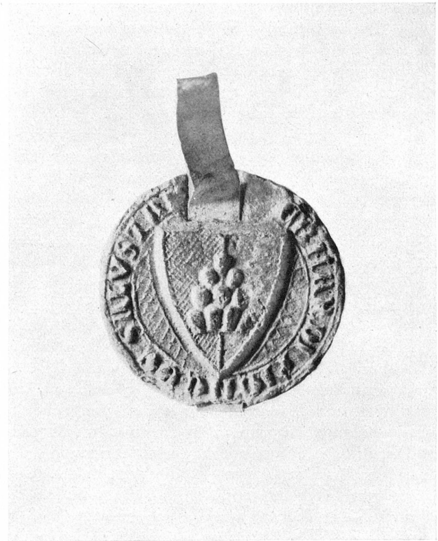
Siegel des Eberhard (III.) von Salenstein aus dem Jahre 1300

Nachkommen zu hinterlassen. Ein anderer Konradus de Salunstein, junior genannt, erscheint zwischen 1260 und 1284 häufig als Zeuge, meist unter Leuten