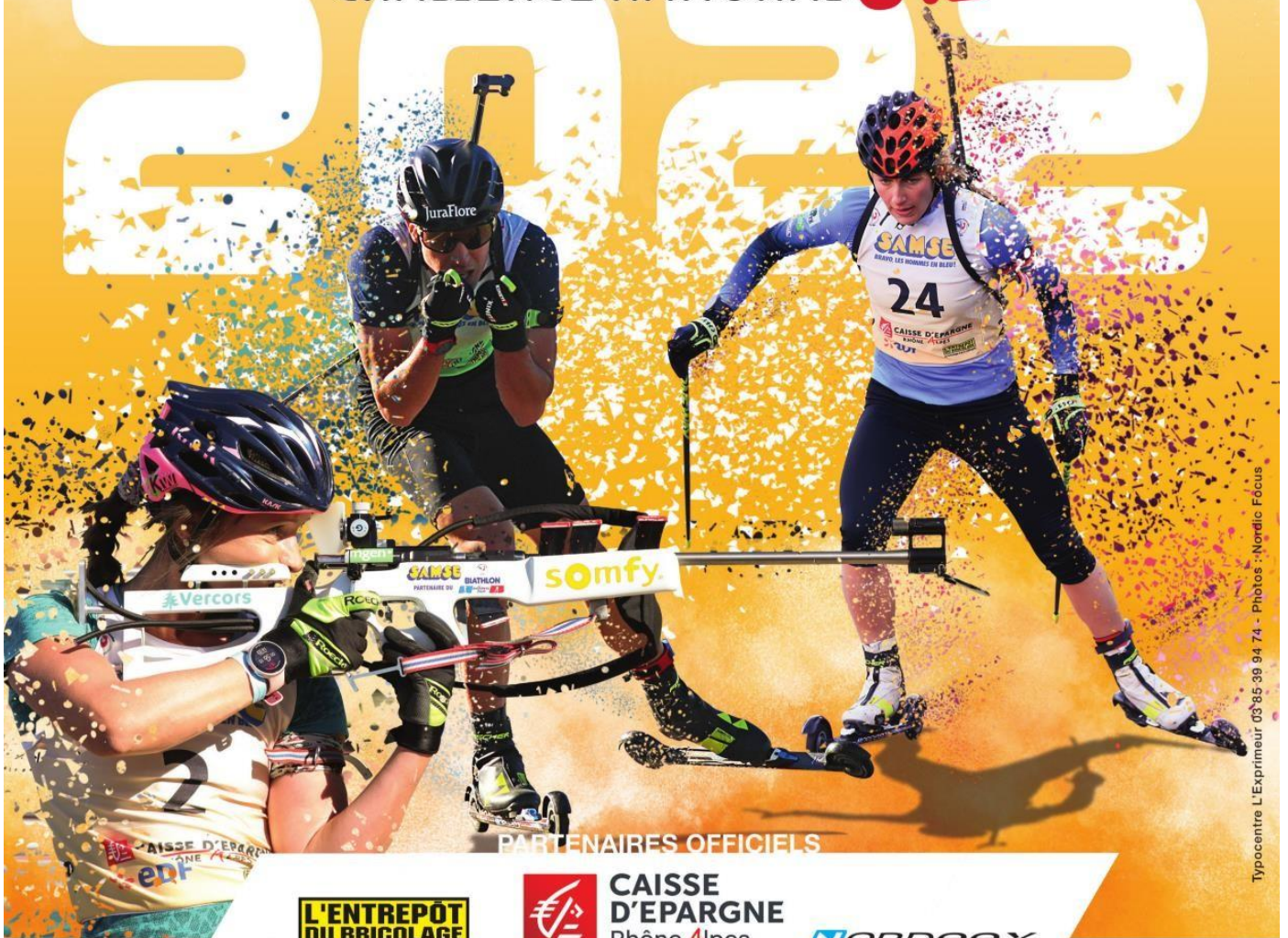
Typocentre L'Expressmeur 03 85 39 94 74