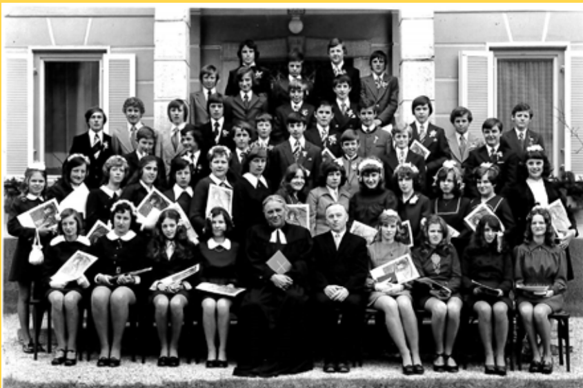
Erkennen Sie schon jemanden auf dem Bild?

50 Jahre später, am Sonntag, dem 07. April 2024 feiern wir im Gottesdienst um 09.30 Uhr in der Evangelischen Kirche in Feld am See das schöne Fest der Goldenen Konfirmation.