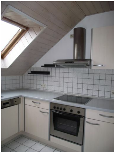
Küche Bild 1