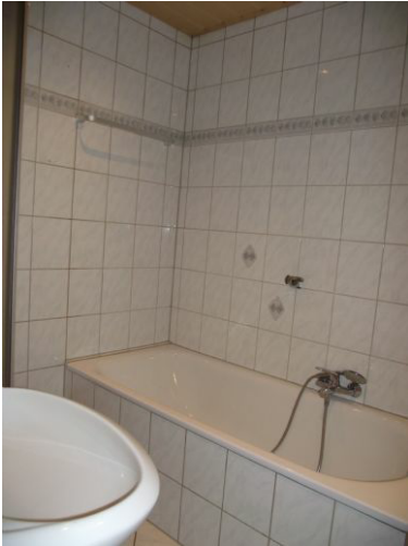
Bad Bild 1