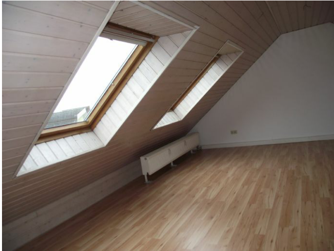
Galerie Bild 3