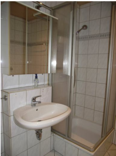
Bad Bild 2