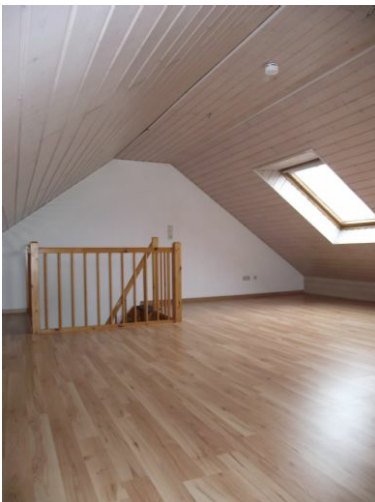
Galerie Bild 2