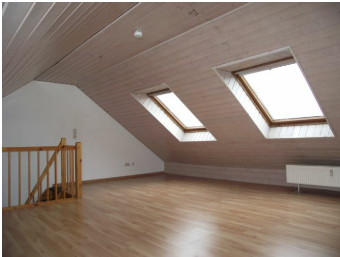
Galerie Bild 1