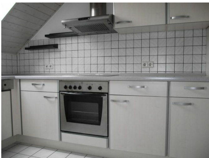
Küche Bild 2