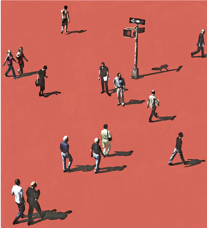
Abbildung 3: Urs Stooss, Red Crossing , 2020, Pigmentprint, Acryl auf loser Leinwand, gerahmt, 90 x 90 cm