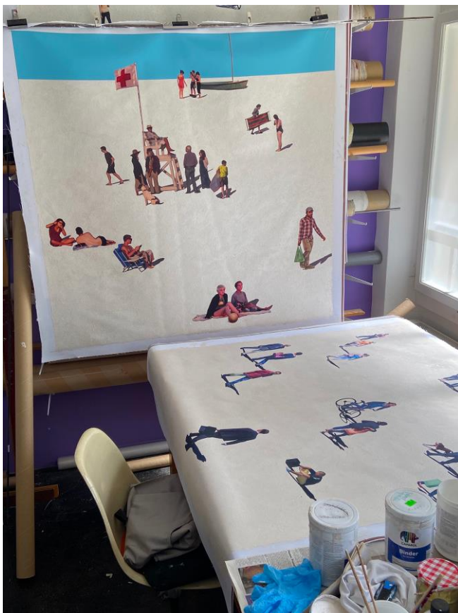
Abbildung 2: Einblick ins Atelier von Urs Stooss in Bern, 2022