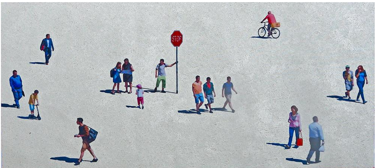
Abbildung 4: Urs Stooss, Stop , 2022, Pigmentprint, Acryl, und Mica-Pigmente auf loser Leinwand, gerahmt, 85 x 60 cm