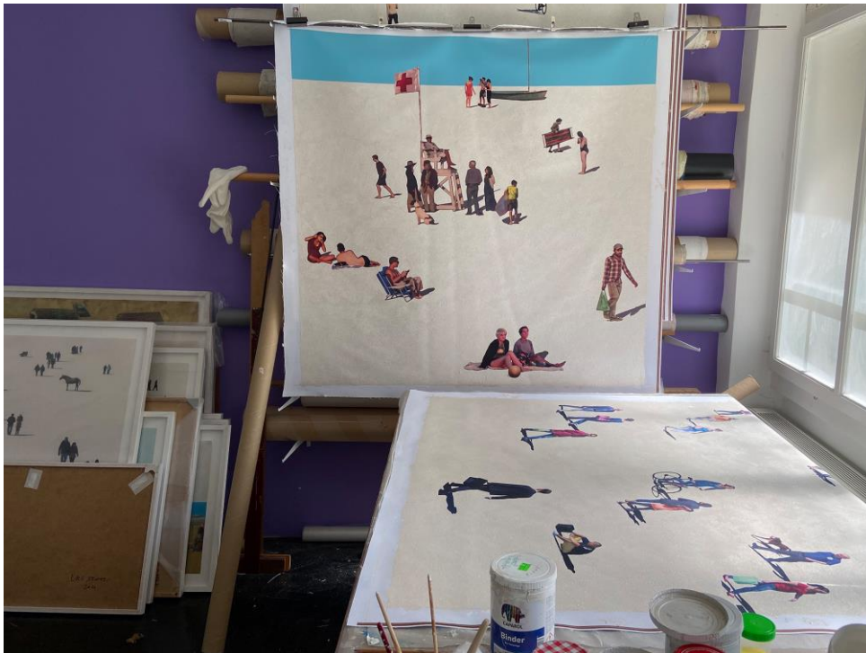
Abbildung 1: Einblick ins Atelier von Urs Stooss in Bern, 2022 (Foto Urs Stooss)